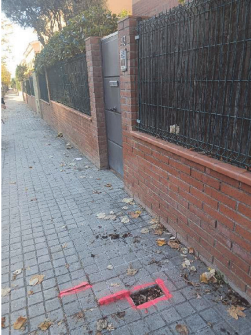
FOTO 4. S'ha procedit a senyalar el perill, mentre no es repari per part de serveis municipals, als que s'ha enviat un correu per a la seva reparació el 25/11/2025."

L'article 67 de la Llei 39/2015, d'1 d'octubre, de procediment administratiu comú de les administracions públiques en relació amb els articles 32 i següents de la Llei 40/2015, d'1 d'octubre, de règim jurídic del sector públic, determinen els requisits que han de concórrer per a poder exigir responsabilitat patrimonial a l'administració: a) Existència d'un dany efectiu, avaluable econòmicament i individualitzat, b) vincle o relació de causalitat entre el fet o acte imputable a l'administració i el dany sofert, c) que el dany s'hagi produït a conseqüència del funcionament normal o anormal dels serveis públics; que no hagi estat causa de força major, és a dir, d'un esdeveniment imprevisible i inevitable que tingui el seu origen en causes, motius o esdeveniments naturals estranys o aliens a la persona obligada.