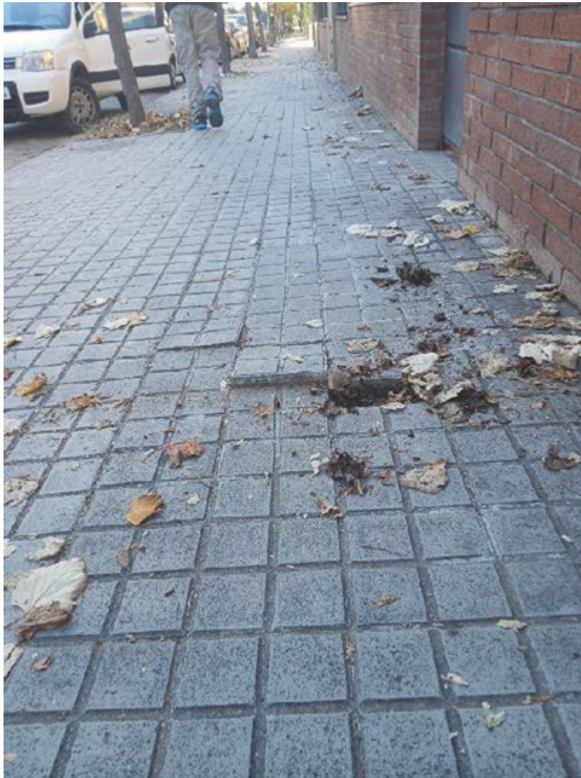
FOTO 3. Vista general dels panots aixecats i la manca de material al panot del costat.

ACTA DE JUNTA DE GOVERN Número: 2026-0007 Data: 23/04/2026