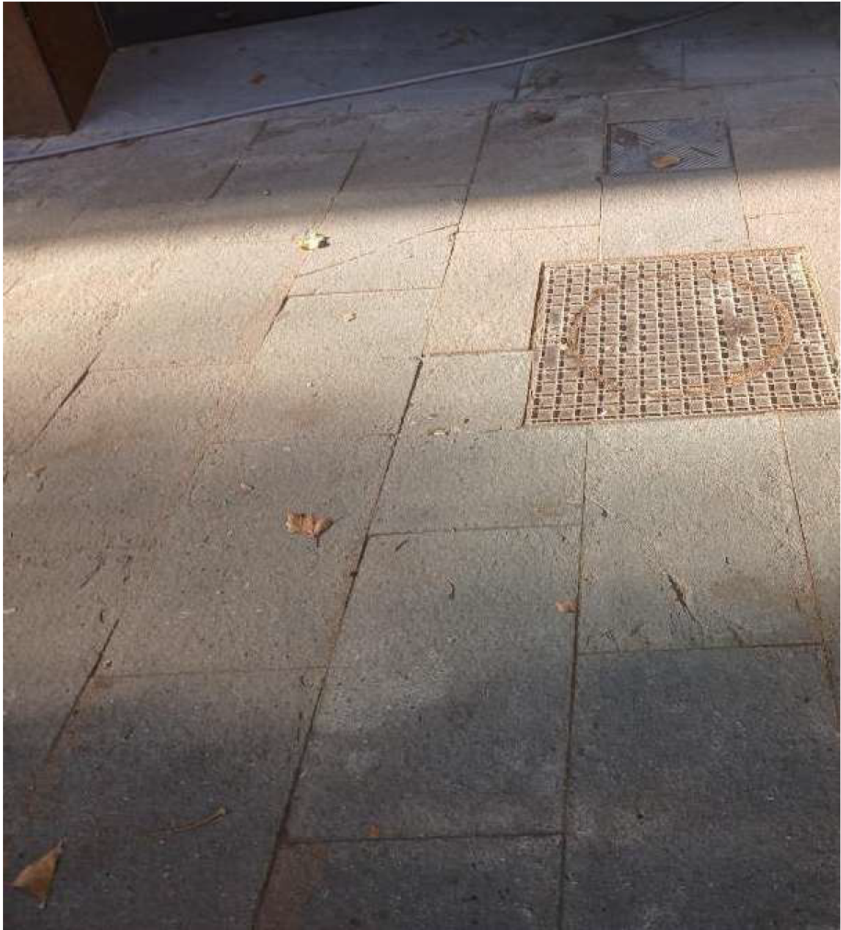
FOTO 1. Fotografia del lloc de la caiguda.