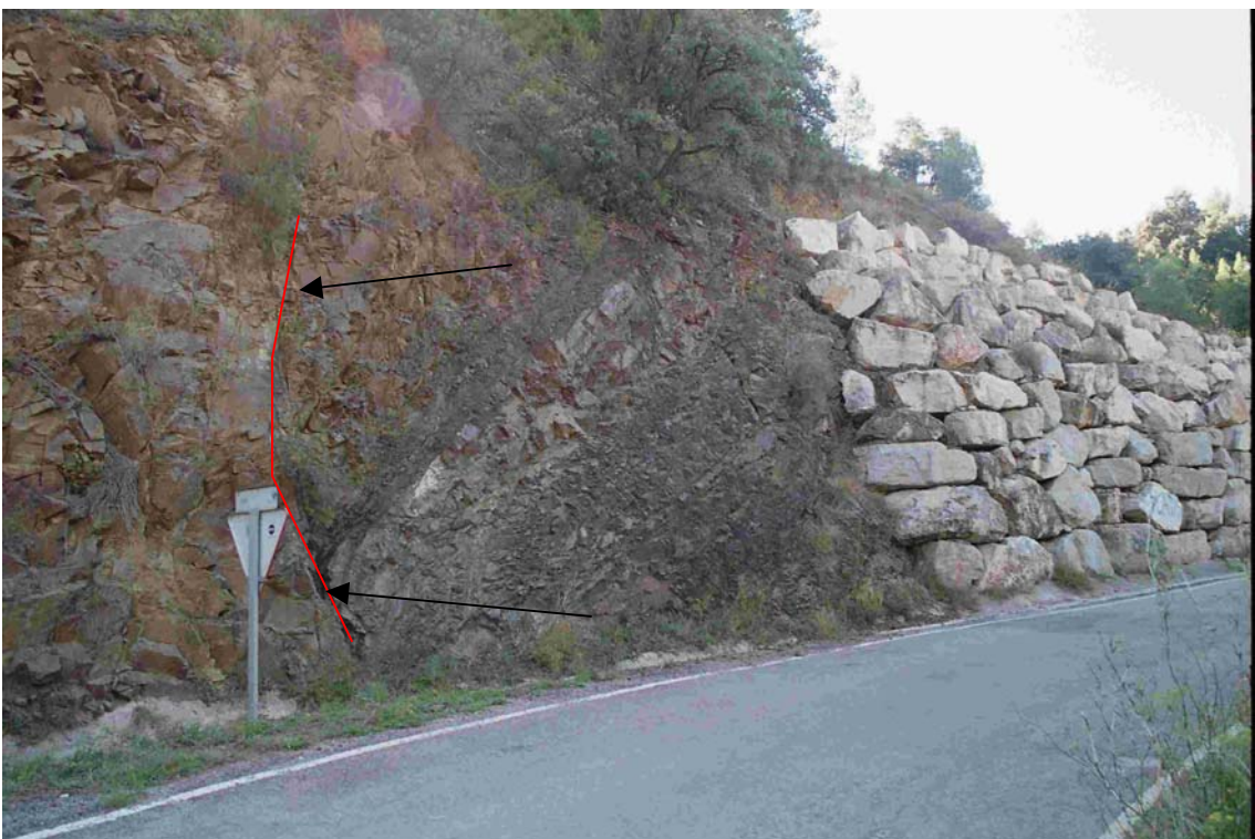
Foto I.1.2 Contacte per falla entre la unitat de calcaries i gresos (esquerra ) i la unitat de pissarres (dreta). La unitat de pissarres és susceptible a crear inestabilitats tal com testimonia el mur d'escullera. Carretera d'entrada a la Vilella Alta.