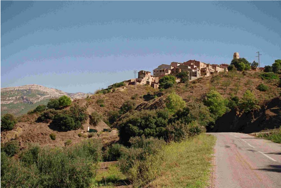
Foto I.1.1 Vista general de la Vilella Alta des del Sud. Els talussos de la carretera T-702 estan excavats en la formació de pissarres, sobre la qual se situa el nucli urbà. Al fons a l'esquerra serra del Montsant.