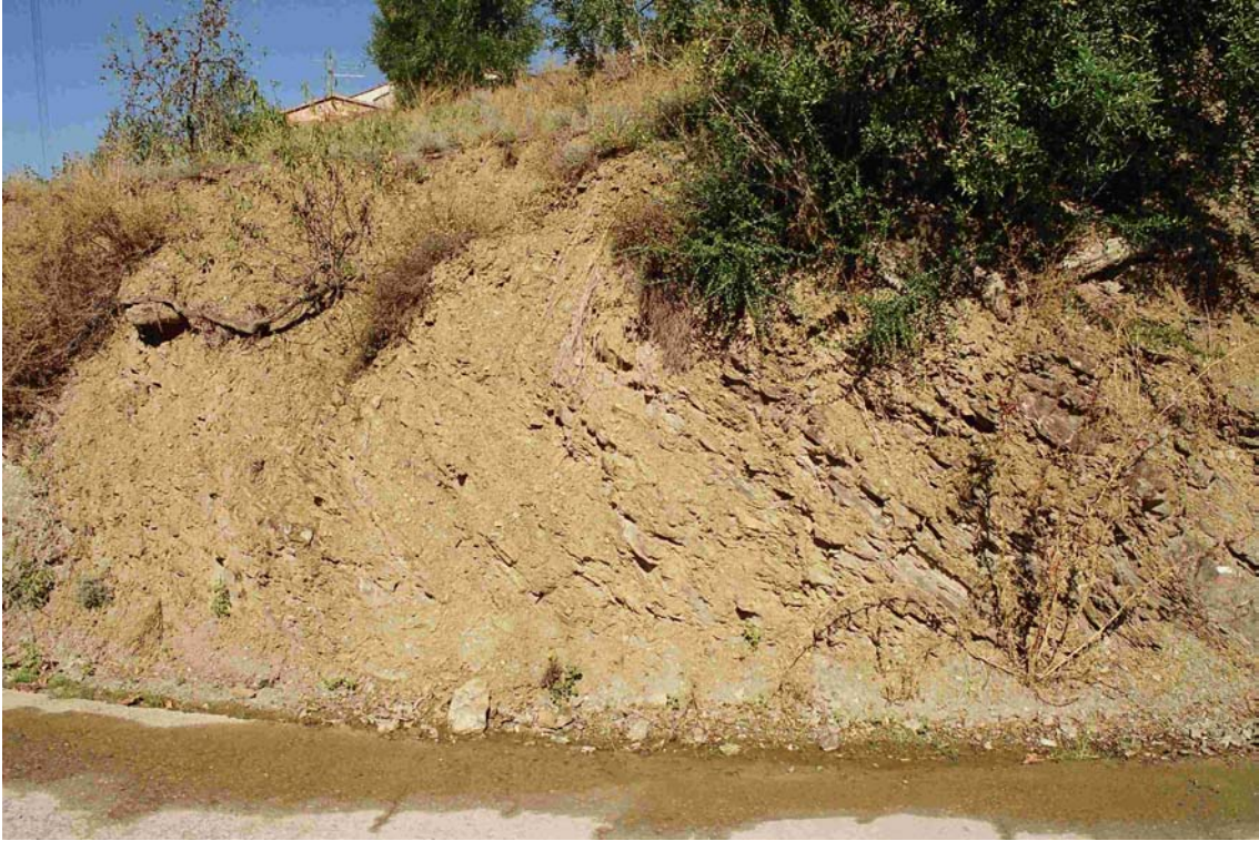
Foto I.1.5. Vista de la formació de pissarres, a la pista d'accés al camí de Torroja. L'aigua que circula pel terra brolla d' una petita surgència un 10 metres a la dreta. La unitat esta aquí inclinada cap a l'est. El contacte amb la formació de roques dures se situa a uns 100 metres a l'est.