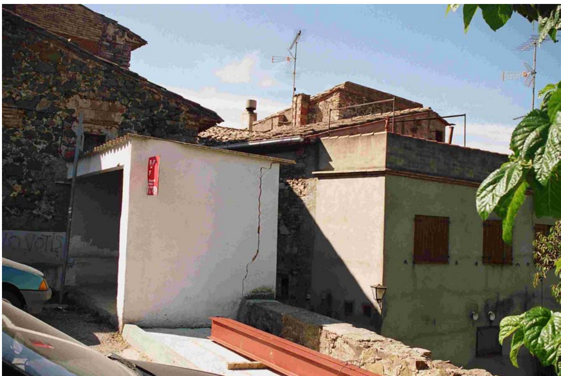
Foto I.1.4. Esquerda a la parada d'autobusos de la Vilella Alta, a la placeta d'entrada a la població.