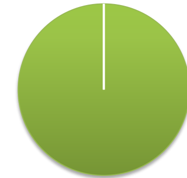
Per tipus de contracte

■ Subministrament ■ Serveis ■ Mixt ■ Obres