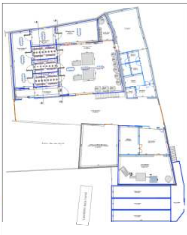
Pla Especial aprovat (planta baixa)