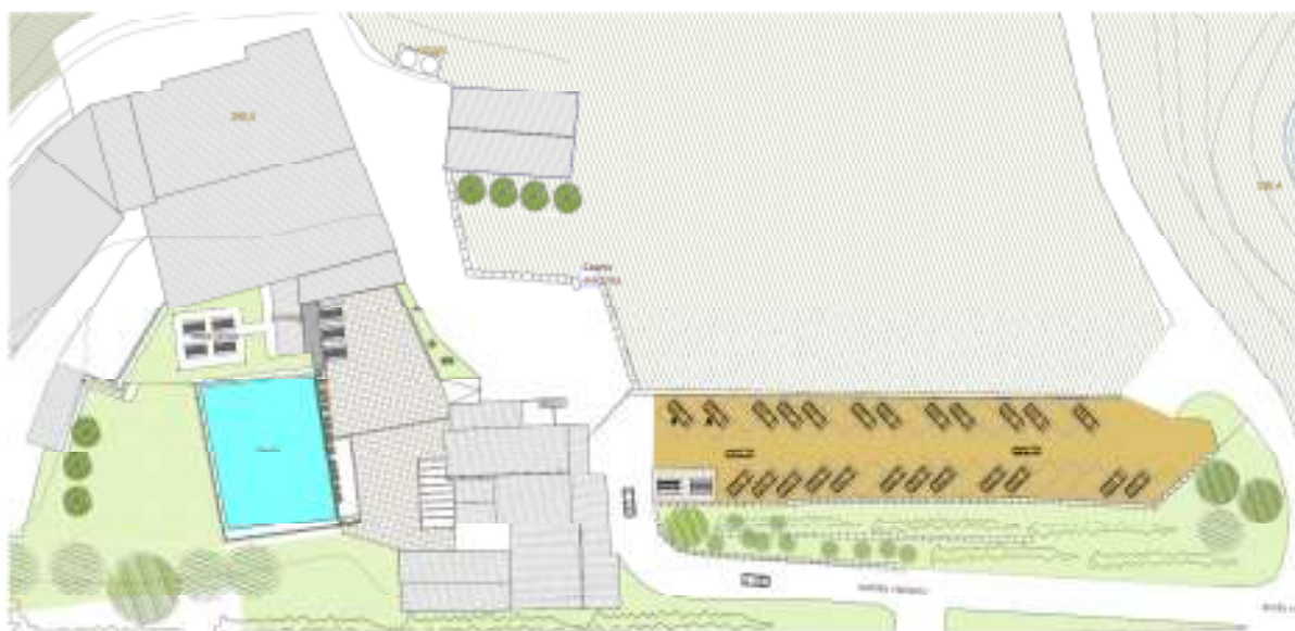
Actuacions executades d'acord amb el projecte de legalització

8.- D'acord amb l'article 7.5 del Text refós del Pla especial d'ordenació de la finca Torre d'en Roca de Sallent, aprovat definitivament per la CTUCC en data 17-07-2015, Es possible l'adequació dels espais assenyalats a l'apartat 2 per a usos propis d'una activitat agrícola i ramadera d'acord el procediment establert a l'art. 49 del TRLU, amb informe previ de la Comissió territorial d'urbanisme d'acord el previst a l'art. 49.2 quan aquest comporti increment de sostre o de volum. En tots els casos, el projecte d'obres haurà de justificar la plena compatibilitat de la proposta amb els usos preexistents i/o previstos en el present Pla especial.