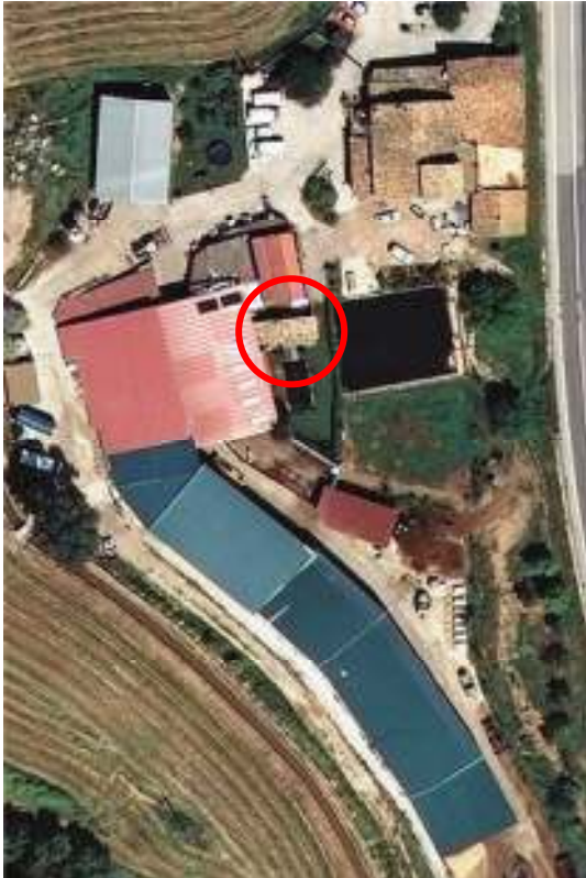
Estat inicial (any 2012)