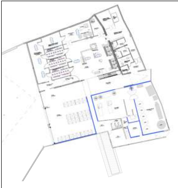
Estat actual pendent de legalitzar (planta baixa)