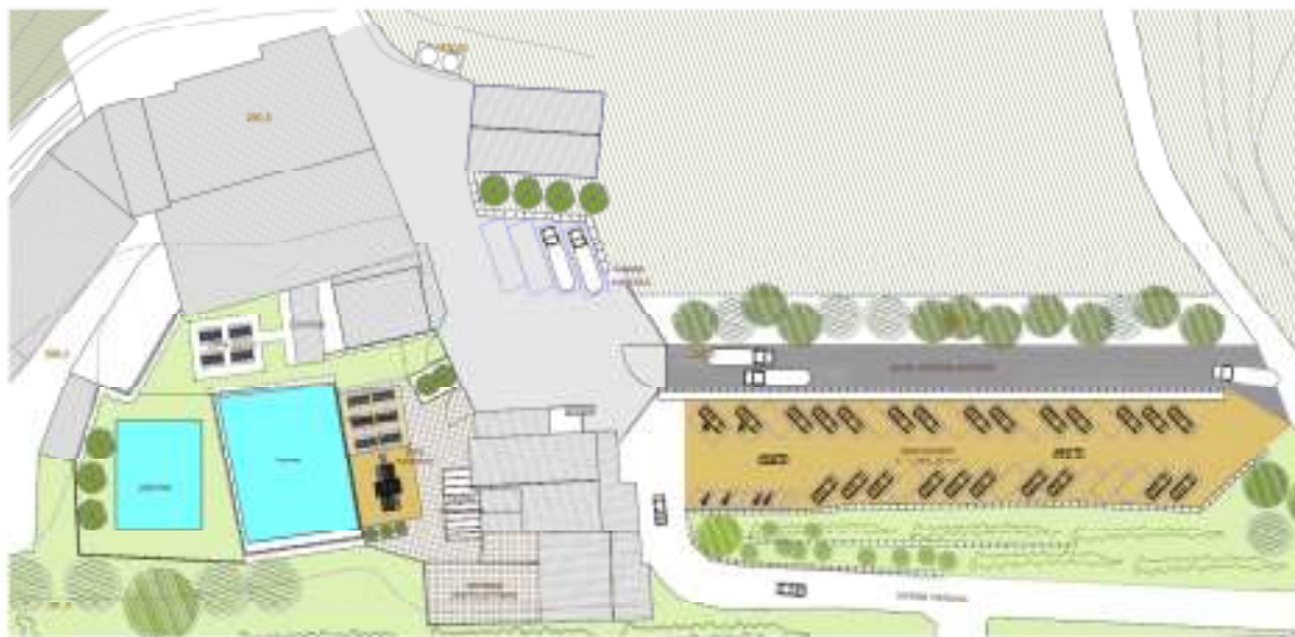
Pla Especial aprovat