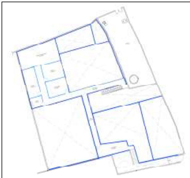
Estat actual pendent de legalitzar (planta primera)

Dels plànols adjunts s'observa que l'espai que el Pla Especial destinava a Sala de Munyir, s'ha destinat a magatzem i zona de Picking de la formatgeria.