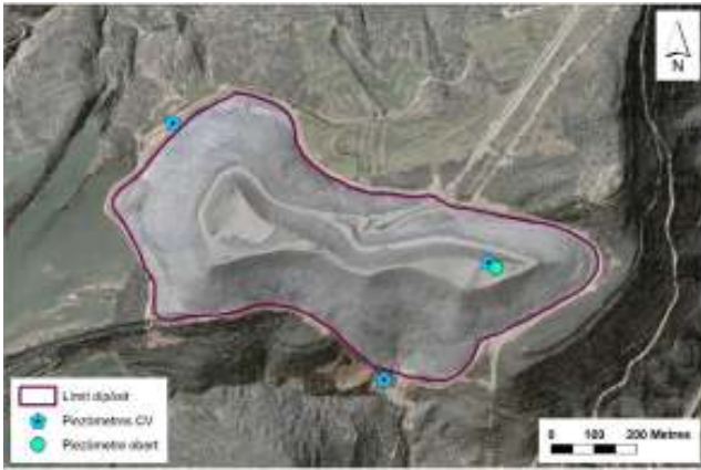
Temptativa de la localització dels piezòmetres