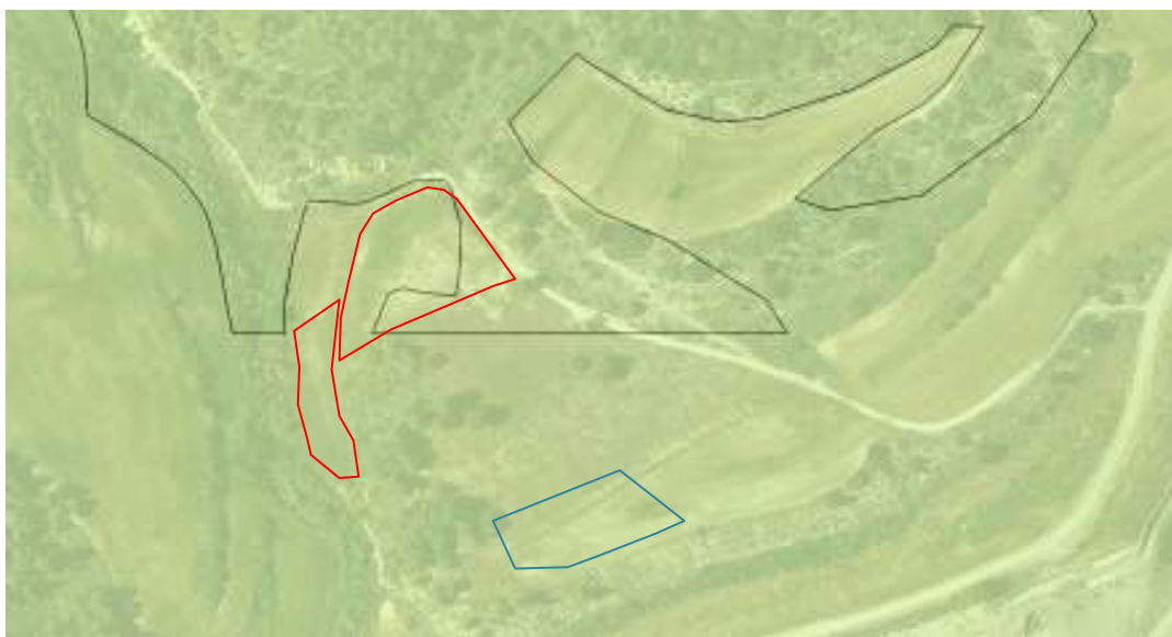
Imatge 1. Superposició del plànol de planejament amb les finques afectades