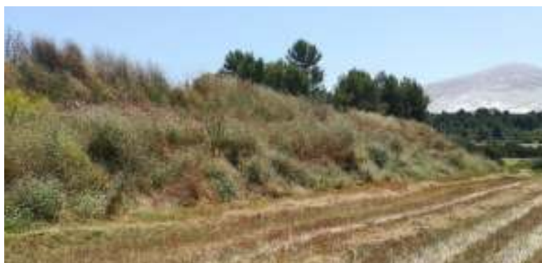
Vista de la zona C