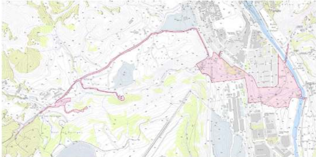
Àmbit del Pla especial

Es fa constar que l'àmbit del PE-02 del POUM s'ha ajustat a la realitat física, ajustant a límits de propietaris, als límits físics reals i a la inclusió de terrenys que es consideren necessaris per assolir els objectius marcats pel POUM, tal i com es fa constar en l'apartat 2 de la memòria del PEU.