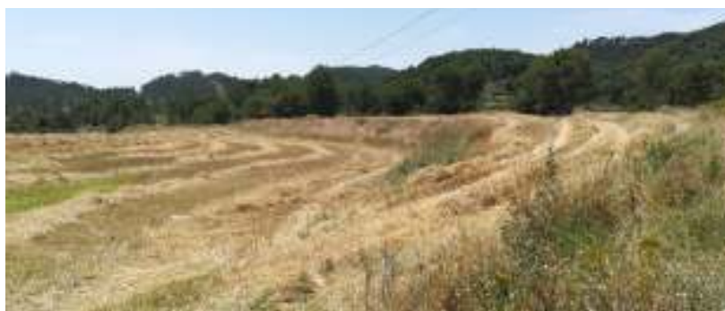
Vista de la zona B