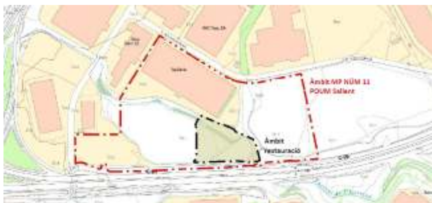
Àmbit del projecte