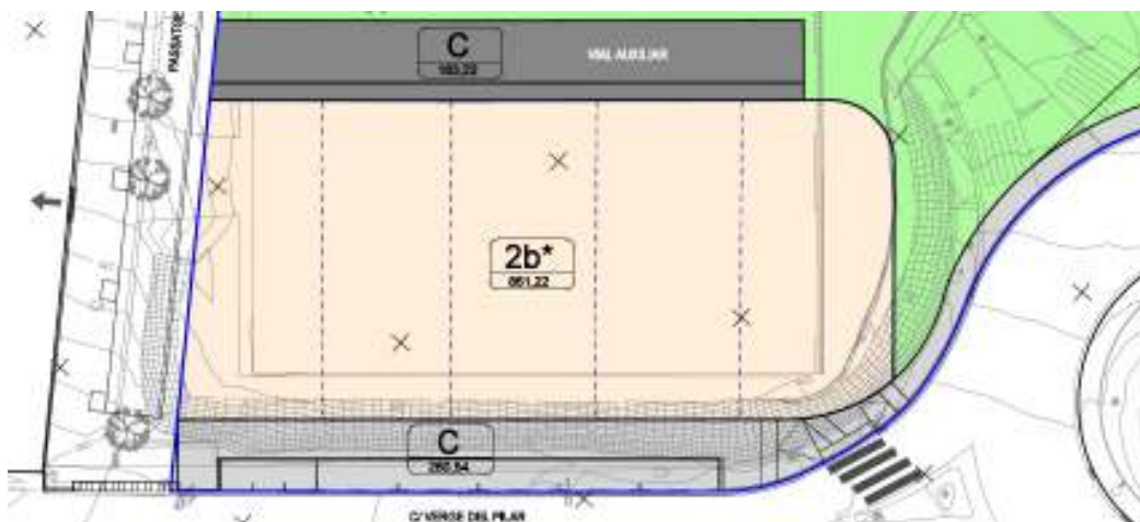
Planta proposta del projecte executiu en tràmit

El projecte preveu modificar la secció de vorera existent del Carrer Verge del Pilar, per tal de dotar-lo de places d'aparcament, de tal manera que es preveu que l'espai que ocupa l'actual vorera passarà a ocupar el nou cordó d'aparcament del carrer, tal i com es pot veure en el plànol de planta i secció adjunts: