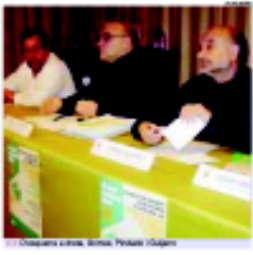
Comissaris de l'AVMIr, Montcada i Reixac

La campanya consistirà a rebre del propietari l'informació de l'edifici, el sector del carrer i el nombre de vehicles que hi ha. La Federació de Veïns de Montcada i Reixac (FVMIr) i l'Associació de Veïns de Montcada i Reixac (AVMIr) treballen conjuntament per aconseguir un millor entorn de vida a la ciutat.