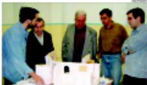
El pessebre de Montcada. A l'esquerra, el taller de treball amb els nens i nenes.

Del 11 de desembre al 7 de gener es podrà veure la moeta a l'entorn dels