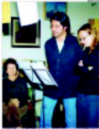
El pessebre de Montcada. A l'esquerra, el taller de treball amb els nens i nenes.