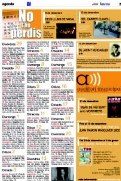
L'Agenda es pot consultar per dia i activitat

Les propostes més atractives es recomanaran en destacat. Sempre que sigui possible s'inclouran imatges il·lustratives. Les activitats de l'agenda s'ordenaran per dia i per tema.