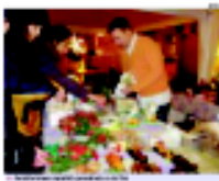
El pessebre de Montcada. A l'esquerra, el taller de treball amb els nens i nenes.

Del Còmic troben sengles fins El taller consistirà en la realització d'un pessebre de Nadal amb els nens i nenes de Montcada. El taller es realitzarà el 11 de desembre a les 10 hores a l'Espai de la Terra. Els nens i nenes podran treballar amb els nens i nenes de Montcada i fer un pessebre de Nadal amb els nens i nenes de Montcada. El taller es realitzarà el 11 de desembre a les 10 hores a l'Espai de la Terra.