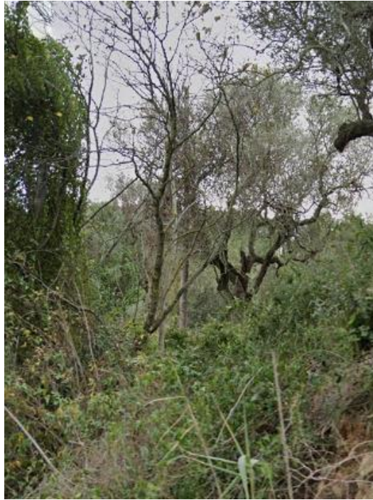
A.3.9. Suport 9: P-100, coordenades X: 339.772 - Y: 4.560.881. Substituir suport de fusta 8 E a fusta 8 D.