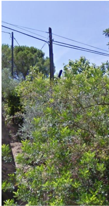
A.3.3. Suport 3: P-61, coordenades X: 340.038 - Y: 4.560.699. Substituir suport de fusta 8 E a fusta 8 D.