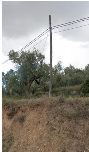
A.3.6. Suport 6: P-78, coordenades X: 339.914 - Y: 4.560.813. Desmuntar riosta ST-2.5 1500 i instal·lar riosta ST-3.0-2000.

Plaça de Catalunya, 1 – 43392 Castellvell del Camp (Tarragona) – Tel. 977 855 008 – Fax 977 855 173 – NIF P43043001 ajuntament@castellvelldelcamp.cat