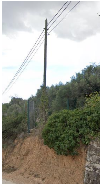
A.3.5. Suport 5: P-76, coordenades X: 339.993 - Y: 4.560.736. Substituir suport de fusta 8 E a fusta 8 D.