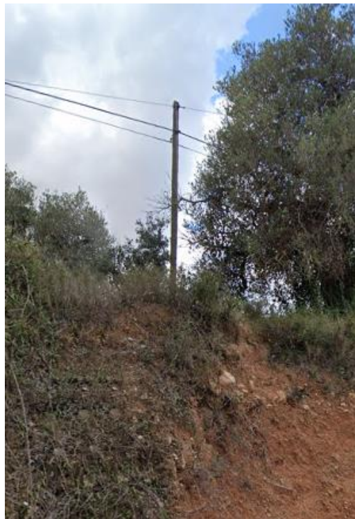
A.3.10. Suport 10: P-10, coordenades X: 339.727 - Y: 4.560.904. Substituir suport de fusta 8 E a fusta 8 D.

Plaça de Catalunya, 1 – 43392 Castellvell del Camp (Tarragona) – Tel. 977 855 008 – Fax 977 855 173 – NIF P43043001 ajuntament@castellvelldelcamp.cat