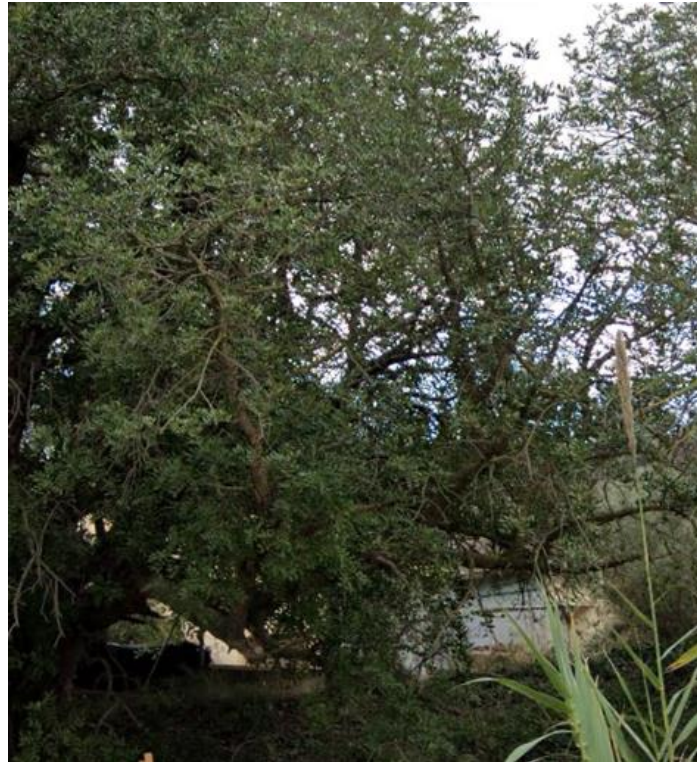
A.3.8. Suport 8: P-93, coordenades X 339.829 - Y: 4.560.844. Substituir suport de fusta 8 D a fusta 8 C.

Plaça de Catalunya, 1 – 43392 Castellvell del Camp (Tarragona) – Tel. 977 855 008 – Fax 977 855 173 – NIF P43043001 ajuntament@castellvelldelcamp.cat