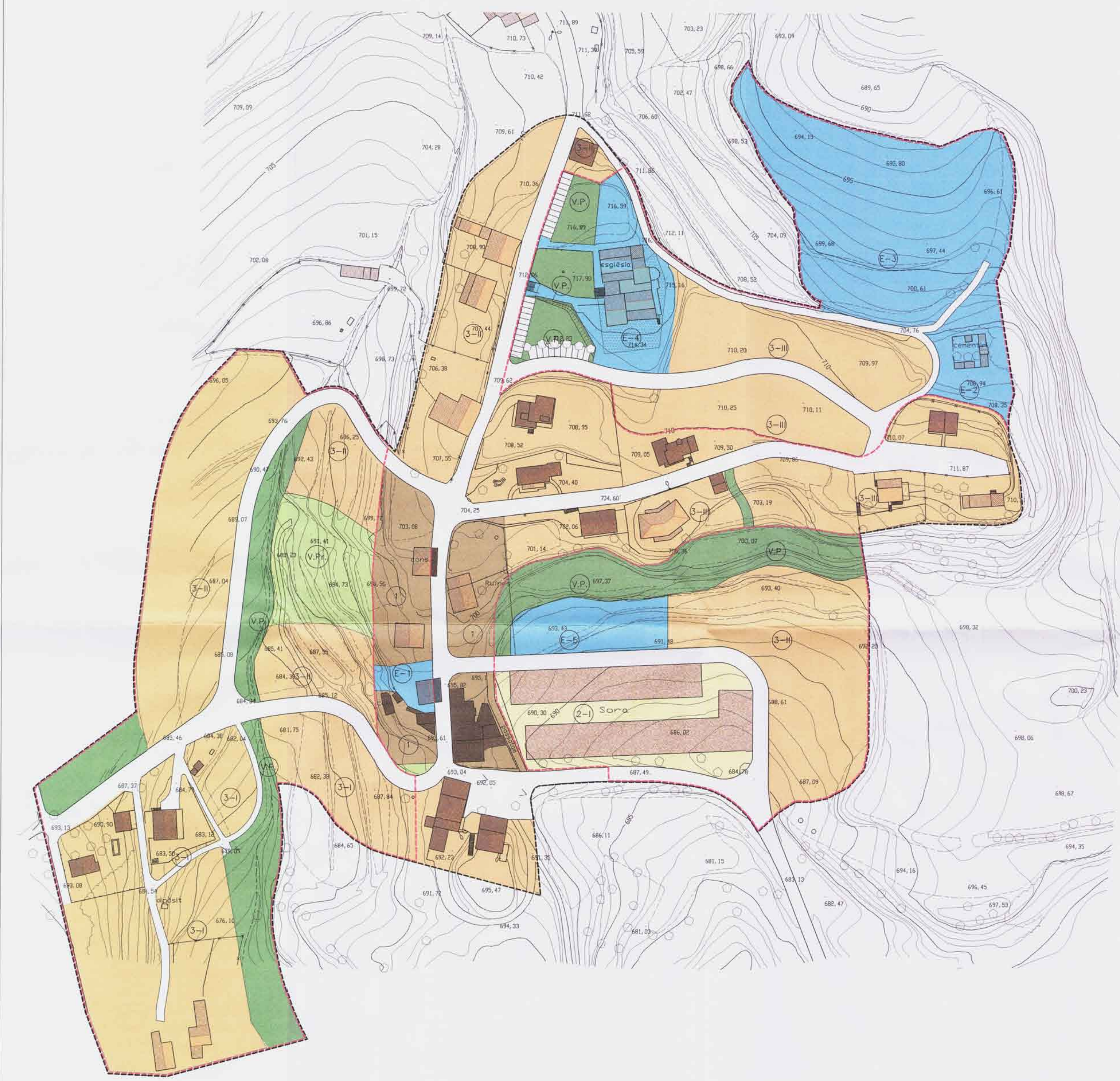
QUADRE DE SUPERFÍCIES DEL SÒL URBA: