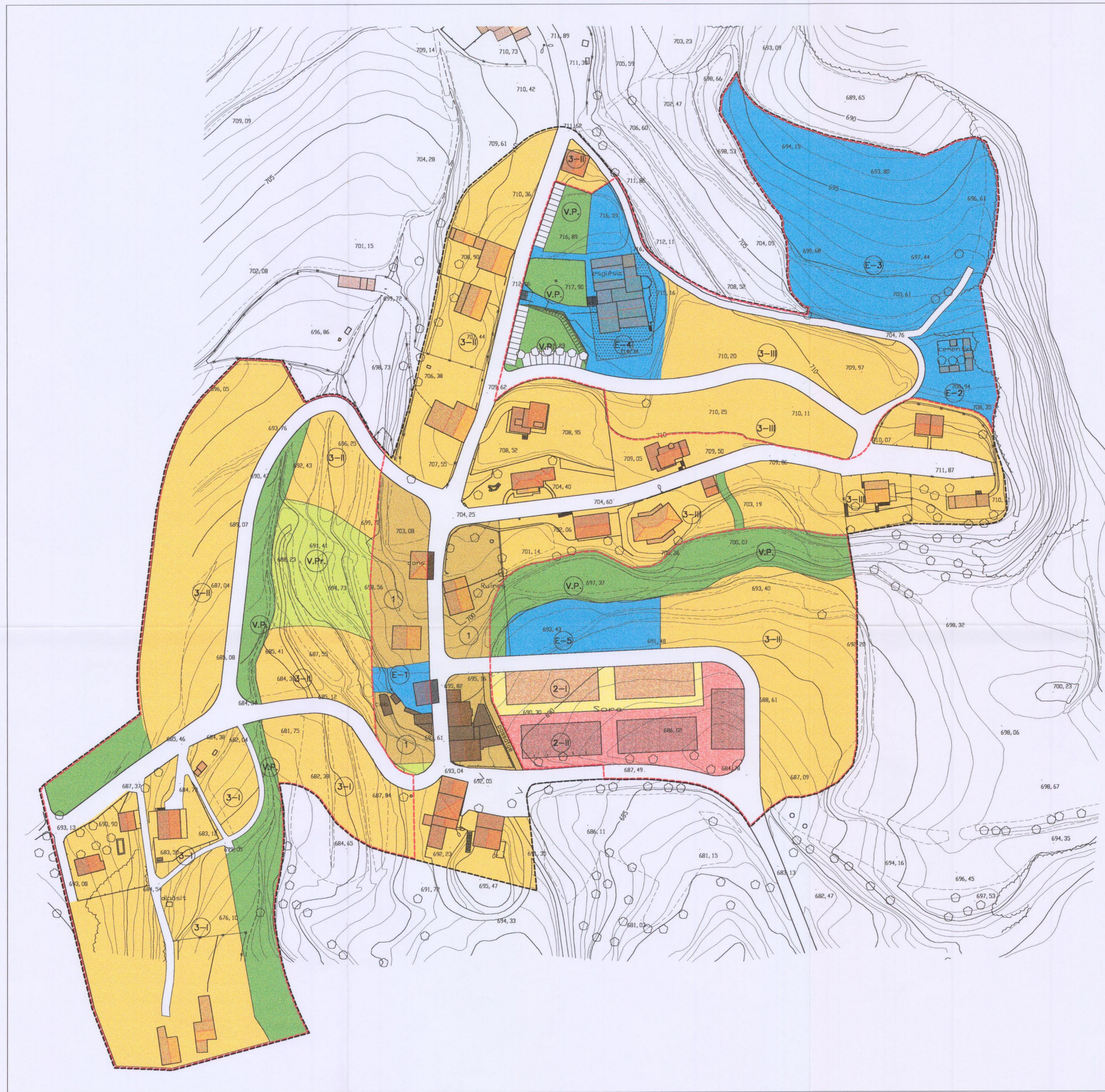
QUADRE DE SUPERFÍCIES DEL SÒL URBA: