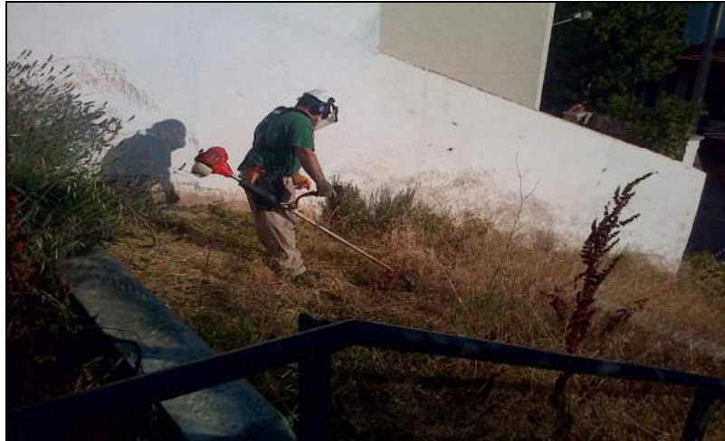
Foto 33. Projecte manteniment de jardineria.