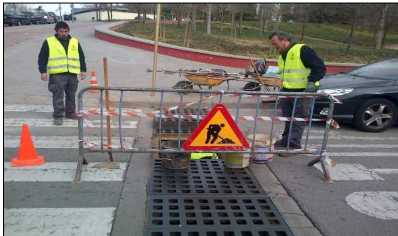
Foto 32. Projecte neteja d'embornals.