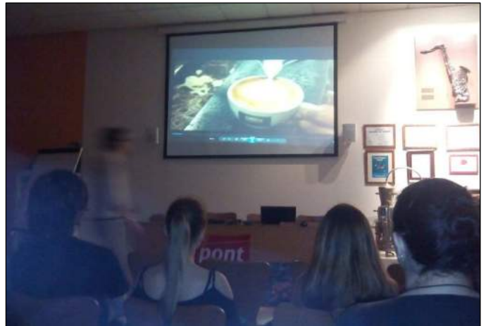
Foto 13. Alumnes visitant empresa Cafès Pont.