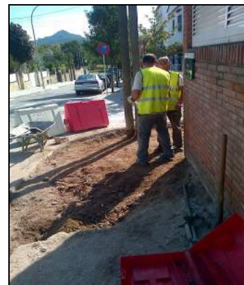
Foto 34 i 35. Projecte de construcció.