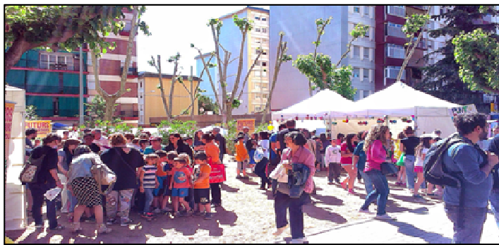
Foto 22.Parades de cooperatives escolars al mercat.