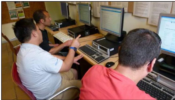
Fotos 5 i 6. Espai del Club de la feina.