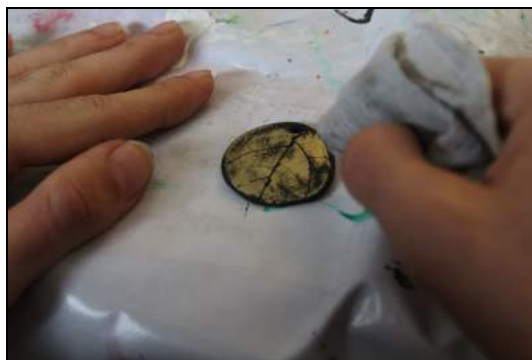
Foto 7. Visita al MAC