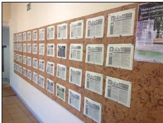
Foto 15. Ofertes de treball. Club de la feina.