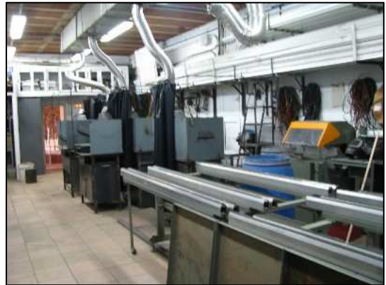
Aula - Taller de Ferreria.