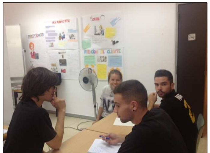
Foto 9. Alumnes JPO durant una tutoria grupal.