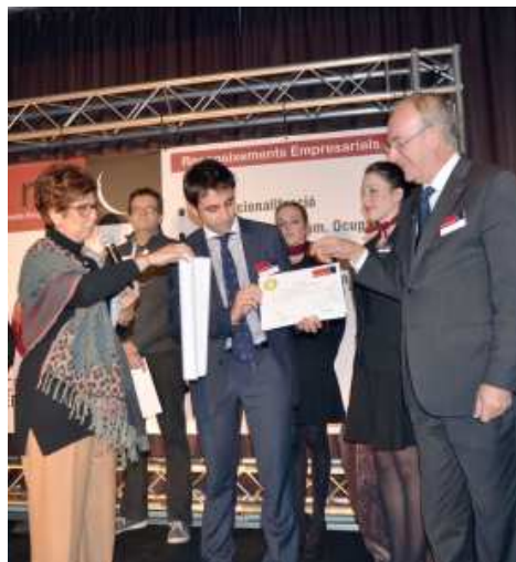
Foto 23.Entrega del premi.