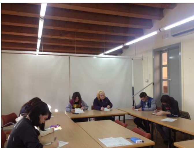
Foto 8. Alumnes JPO durant la formació professional.

En quant als resultats del programa podem fer una valoració molt positiva; d'una banda s'han inserit un total de 15 alumnes, aconseguint un 100% d'inserció en relació als alumnes atorgats. I Pel que fa a la reinserció educativa, 5 alumnes han retornat al sistema educatiu a l'escola d'adults i l'IOC per obtenir el graduat de la ESO i 3 més estan cursant cicles formatius de Grau Mitjà, 3 alumnes estan realitzant formacions d'anglès i d'atenció al client, i 1 està realitzant el curs Pont a Grau Superior. Per tant un total de 12 joves retornen al sistema educatiu representant un 80% dels alumnes.