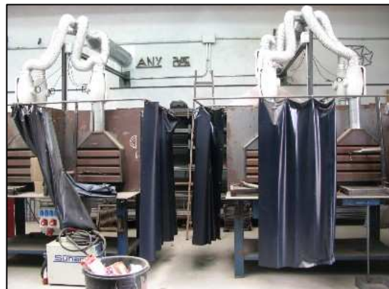
Aula - Taller de Soldadura.