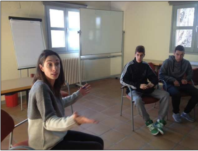
Foto 10. Xerrada Empresa Taller de Cultura.