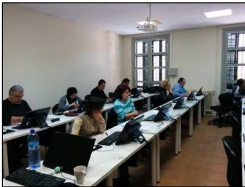
Fotos.1,2,3 i 4. Espais de recerca de feina.

Les dades de participació han estat les següents: 358 persones participants, 25 persones més del objectiu establert pel SOC (333 persones).