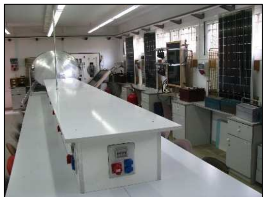
Aula taller d'energia Solar- Tèrmica.