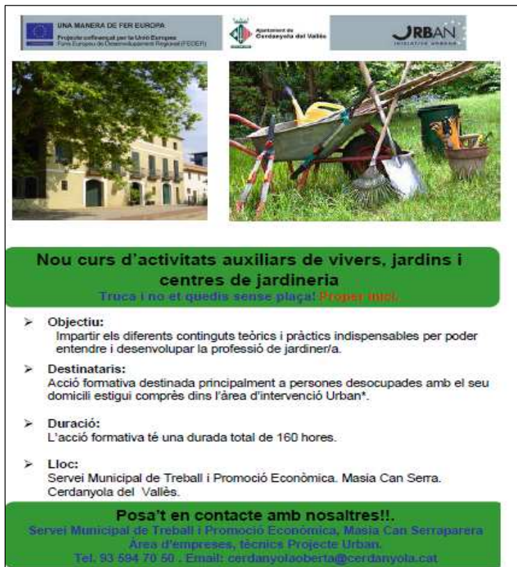
Fotos 18 i 19. Publicitat dels cursos URBAN.