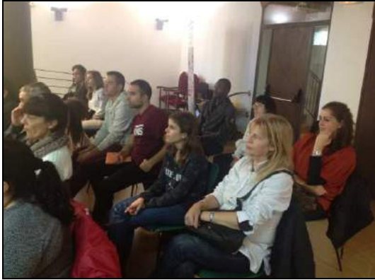
Foto 14. Sessió grupal.

Durant l'any 2015 s'ha portat a terme el Projecte Agència de Col·locació derivat de l'Oficina de Treball de la Generalitat per les Agències de Col·locació.