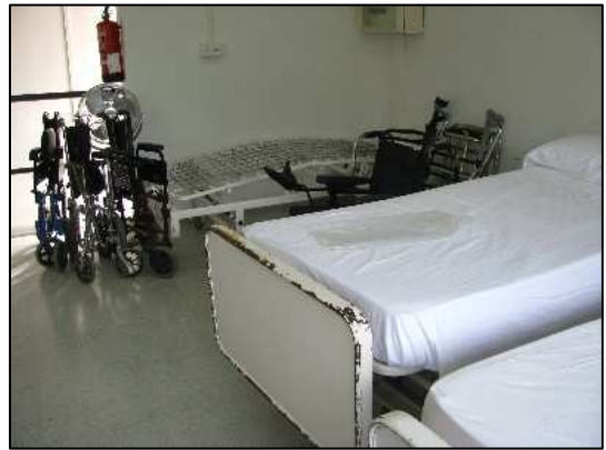
Aula d'atenció Sociosanitària.