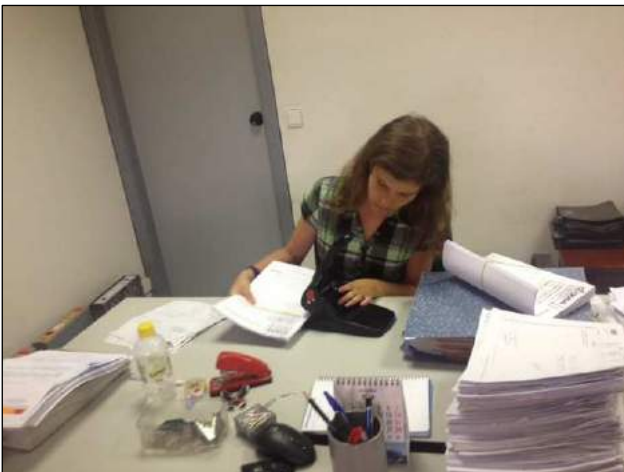
Foto 12. Pràctiques alumna a l'empresa SUMARGO 92 S.L.