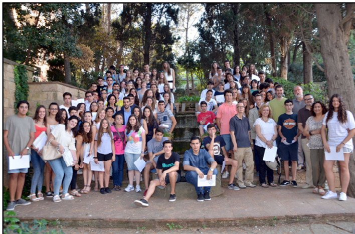
Foto 21. Setena Edició del concurs Millors Idees Empresarials innovadores Can Serraparera.

S'ha realitzat la tercera edició del Programa experimental Innovador de la Cultura Emprenedora a l'Escola de la Diputació de Barcelona. Aquest programa es fa amb el suport de la Diputació de Barcelona i consisteix en la constitució d'una cooperativa, fabricació de producte, venda, repartiment del 10% dels beneficis a una entitat social i tancament de la cooperativa. En aquest programa hi participen tres escoles: Serraparera, Xarau i Carles Buïgas amb 150 alumnes de cinquè de primària. Dins d'aquest programa, s'ha fet les següents accions: