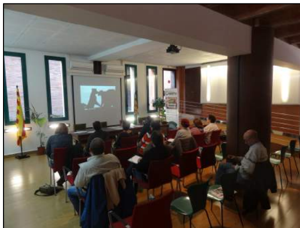
Foto 16. Alumnes del programa.

Per altra banda, el programa contempla unes pràctiques professionalitzadores que variaran segons el perfil professional dels usuaris/àries. A grans trets aquestes tindran una durada de com a màxim 100 hores i una jornada màxima de 5 hores/dia i 25 hores setmanals.