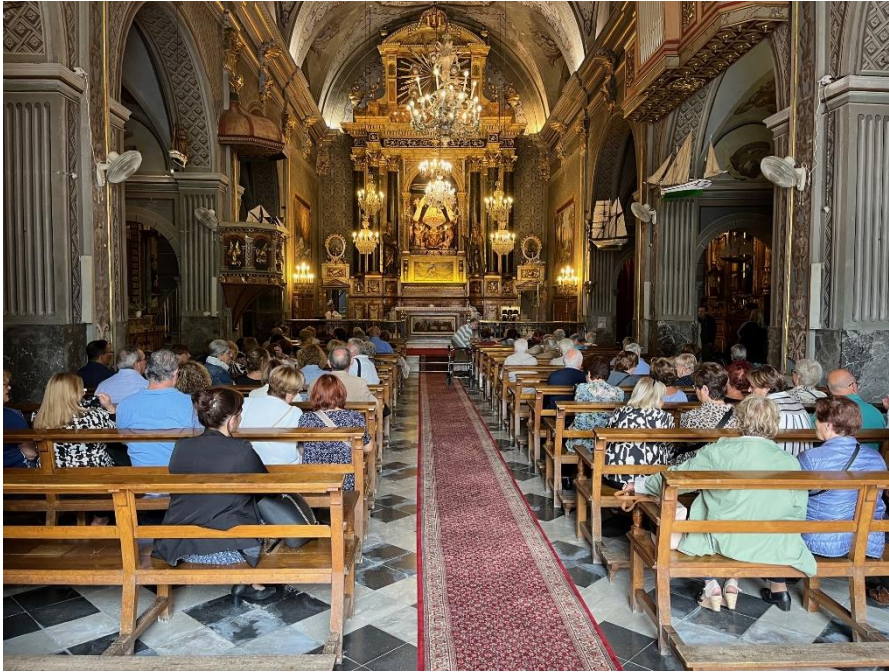
Visita al Santuari de la Mare de Déu del Vinyet, 26 d'octubre de 2023