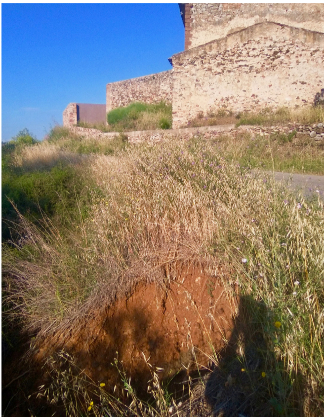
Aiguat a les Canals, camins en mal estat i esvoranc al costat de la carretera dels Guiamets, en el qual caldrà la intervenció municipal.

Els més de cent litres per metre quadrat que van ploure a final de maig al terme municipal van ocasionar diversos problemes en la xarxa de camins i van obligar l'Ajuntament a fer intervencions d'urgència.