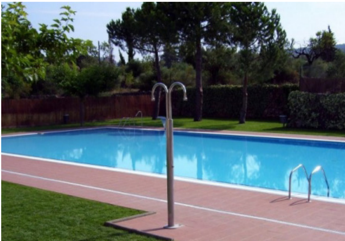
Els darrers mesos s'han dut a terme diversos treballs de condicionament del recinte.