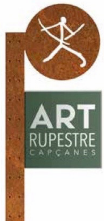
Elements de senyalització.

El projecte preveu diverses intervencions. D'una banda, es projecta l'adequació de dos pàrquings: un primer, al Bassot, i un segon en el nucli urbà, a l'entrada del poble. D'altra banda, també està previst el desplegament de senyalització viària que informi els visitants, tant abans d'arribar a Capçanes com per adreçar-se del poble a les pintures. També es contempla l'habilitació de passeres per a vianants en l'interior dels tancaments que ara protegeixen els jaciments. El pla ja compta amb una subvenció de la Diputació de Tarragona, i el seu desplegament es farà de manera paulatina a mesura que els recursos econòmics ho permetin.