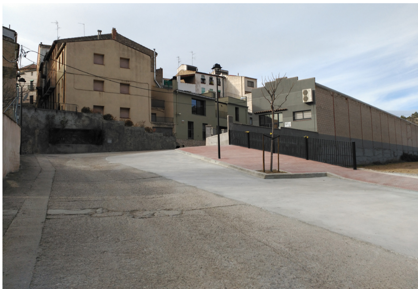
El carrer Llaberia, un cop ampliat.