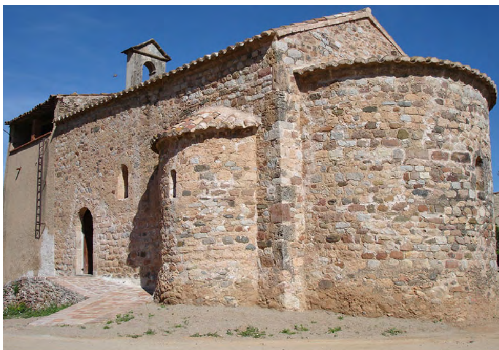
ERMITA DE SANT PERE ULLASTRE