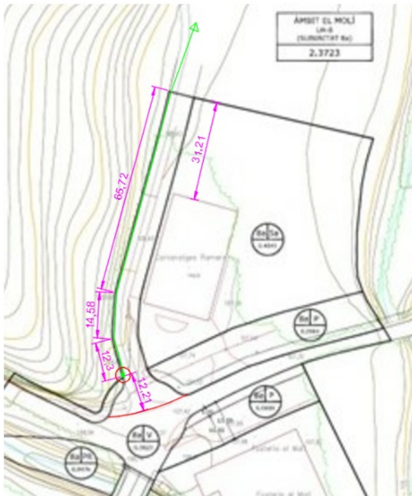
Traçat inicial acotat