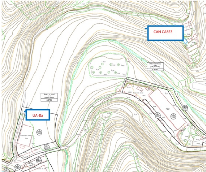
Plànol urbanístic de situació