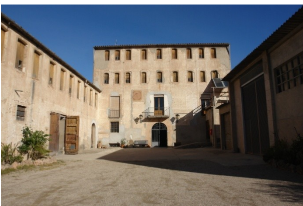
7-Molí del Cover