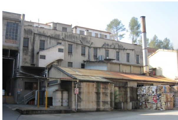
10-Molí d'en Ribalta