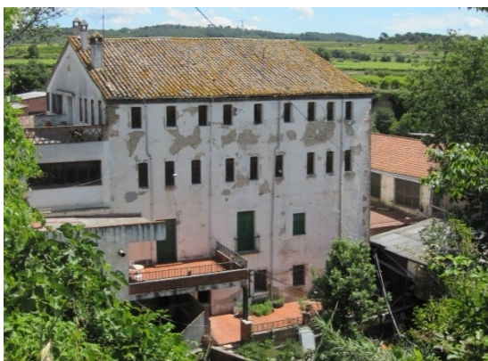
1-Molí d'en Vinyals

Aquests treballs de camp han permès el reconeixement detallat de cada un dels molins paperers i la redacció de les fitxes 1 "Identificació" i 2 "Descripció física i estat de conservació", i una primera aproximació a les fitxes 6 i 7 "Delimitació de l'àmbit de protecció" i 8 "Determinacions normatives. Categories de protecció".