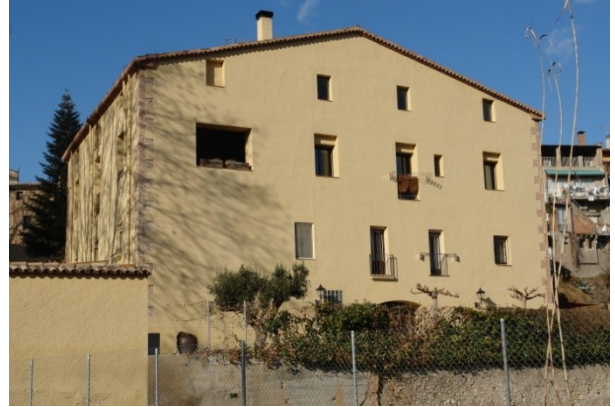
4-Molí d'en Roda