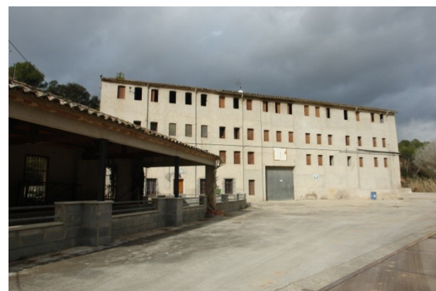
8-Molí de l'Esbert