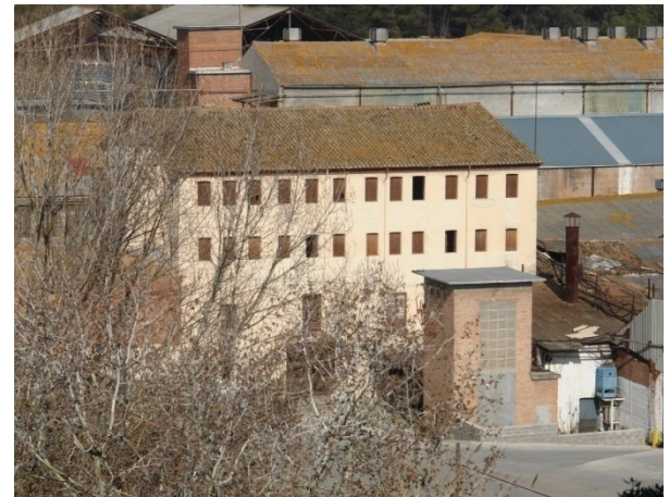
6-Molí del Mig