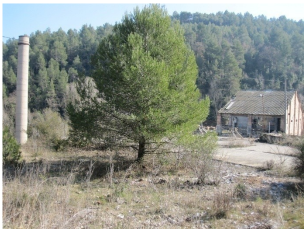
11-Molí de Cal Cardús