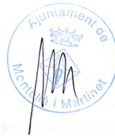
Josep Castells Farràs Alcalde