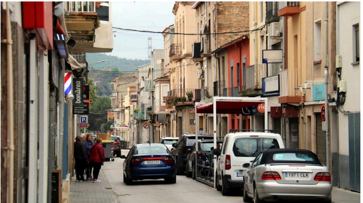
Sant Vicenç de Castellet és un dels municipis que nota la pressió habitacional de l'àrea metropolitana

Sant Vicenç de Castellet presenta una nova edició dels pressupostos participatius