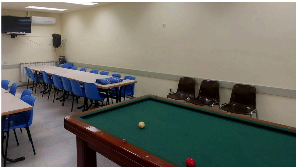
Nou aspecte del Casal de la Gent Gran de Castellbell | AiCbiV

Les activitats del Dia Internacional de les Persones Grans a Manresa compten amb 3.300 participants