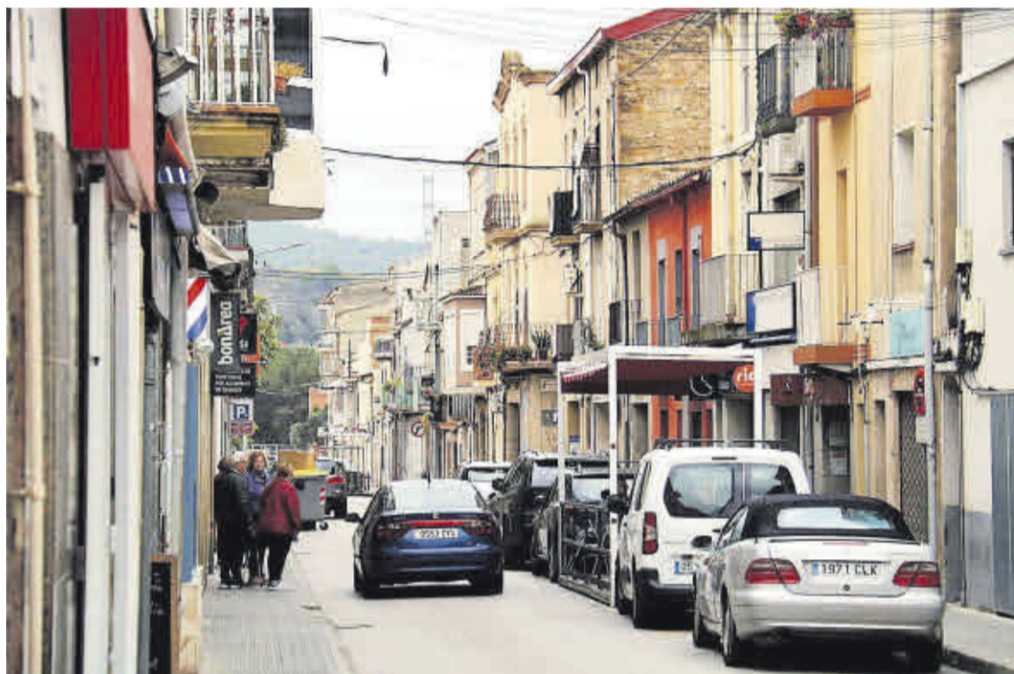
Vista general del carrer Gran de Sant Vicenç de Castellet