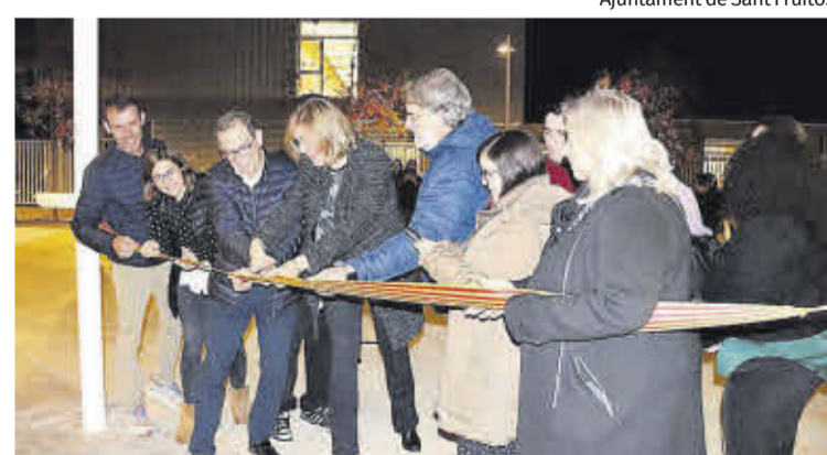
Moment del tall de cinta inaugural del nou parc

conserva elements de l'antiga escola, com la pèrgola metàl·lica, i que també s'ha adquirit un trenet de fusta igual que els que hi havia hagut al pati de l'equipament, elements que permeten deixar constància de la utilitat prèvia que va tenir aquest espai. També va agrair al jovent de l'institut la proposta que els van fer arribar per tal de denominar aquest espai amb el nom de la Nobel de literatura Annie Ernaux, destacant la importància d'ampliar el nombre d'espais públics del municipi amb noms de dones. ■