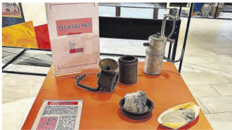
El llum de carbur és la peça del mes d'aquest novembre