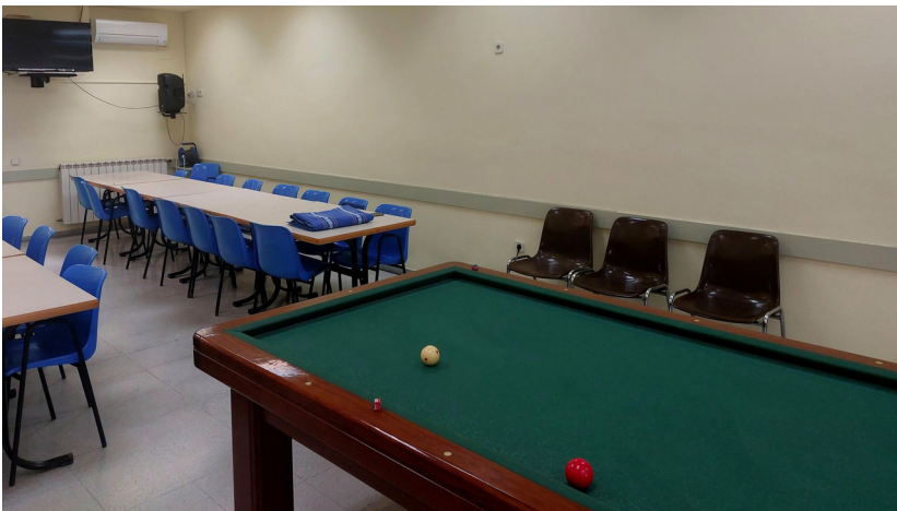
Castellbell fa una primera actuació de millora al Casal de la Gent Gran.

Els treballs han consistit en la pintura de la sala principal, que tenia les parets malmeses, i pròximament s'actuarà als lavabos.