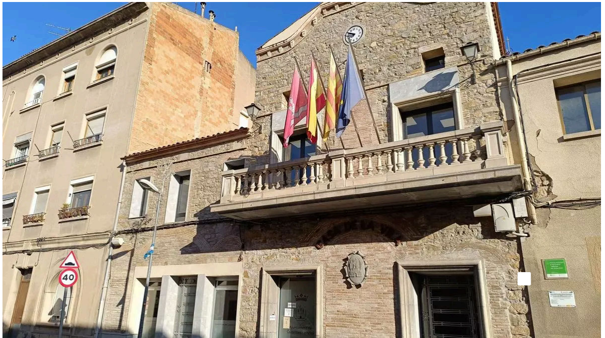
Façana de l'Ajuntament de Castellbell

El ple aprova per unanimitat assumir una despesa de 9.200 euros per una obra a la piscina en el passat mandat, que l'actual govern diu que va ser encarregada de forma irregular i el PSC ho nega