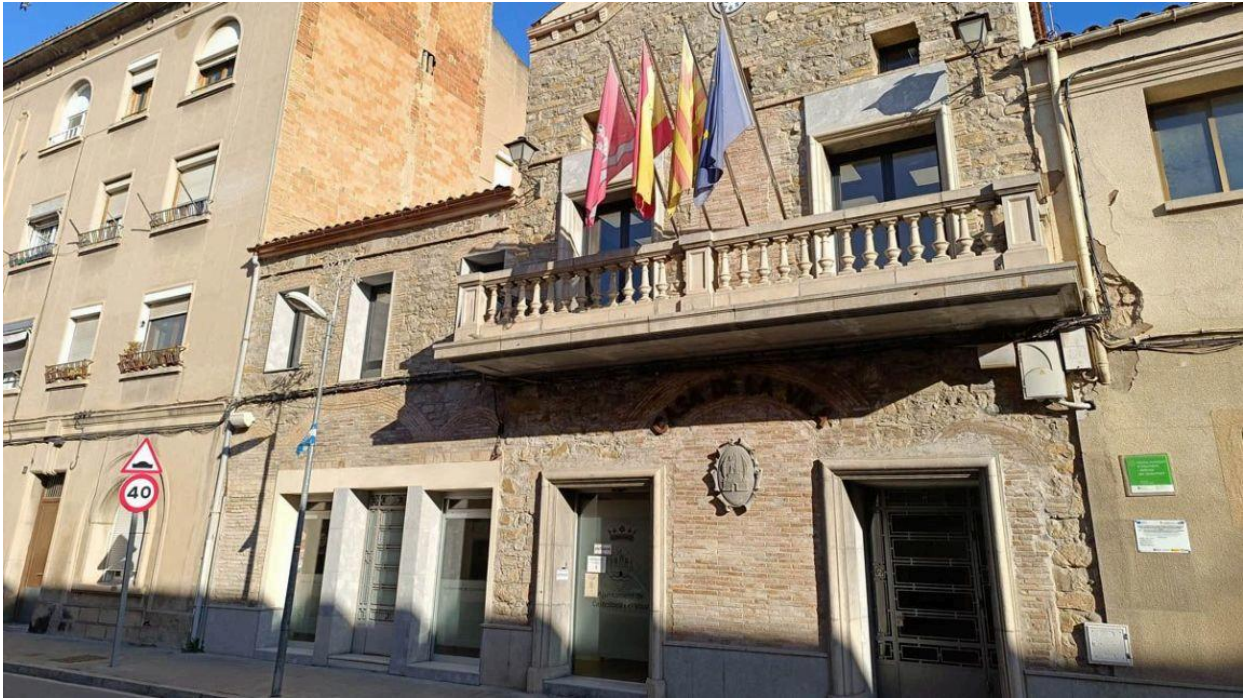
Ajuntament de Castellbell i el Vilar | AjCbiV