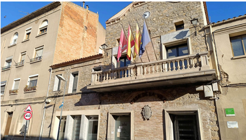
Castellbell i el Vilar assumeix el pagament d'una factura pendent de fa dos anys i mig.

El ple de novembre aprova per unanimitat assumir una despesa imprevista de 9.200 euros corresponent a unes obres a la piscina fetes el febrer de 2022 que es van encarregar sense la realització de cap contracte ni comanda per part de l'anterior consistori.