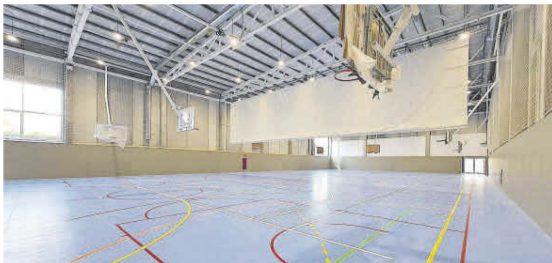
Ajuntament de Santpedor