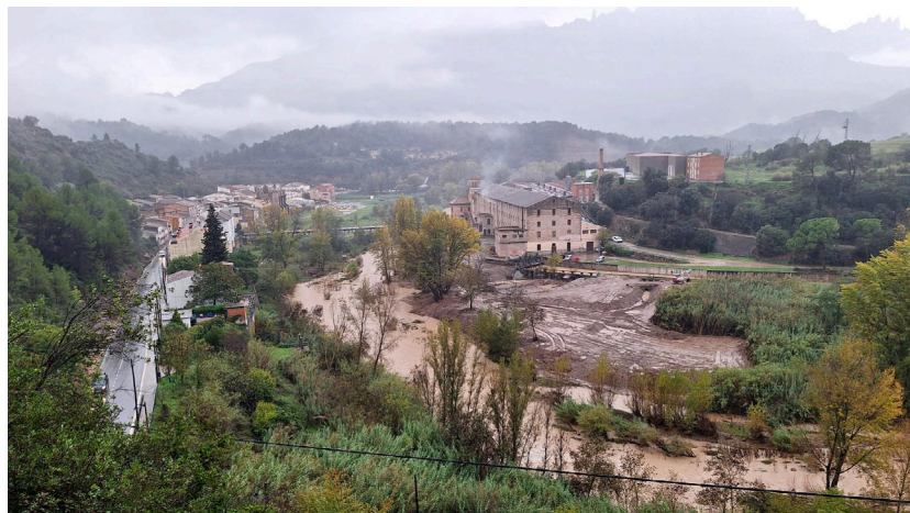
Castellbell i el Vilar finalitza les obres per al manteniment de la llera del Llobregat.

Els treballs han tingut una durada d'un mes i han facilitat l'eliminació del canyissar i les tasques de desbrossat i tala d'arbres morts.