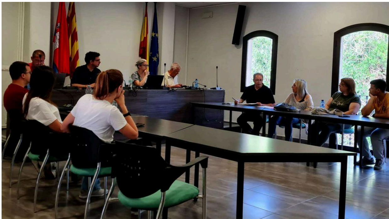
El ple de l'Ajuntament de Castellbell en una imatge d'arxiu