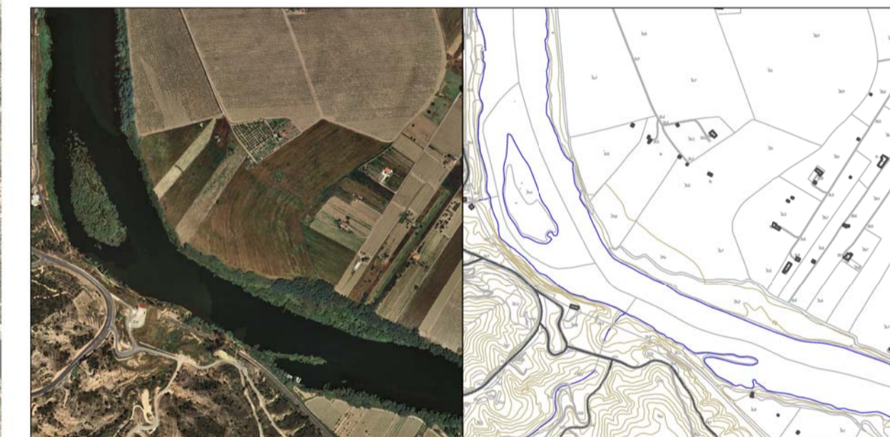
4 Zona fluvial