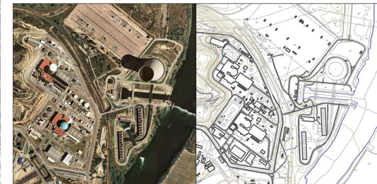
6 Central nuclear