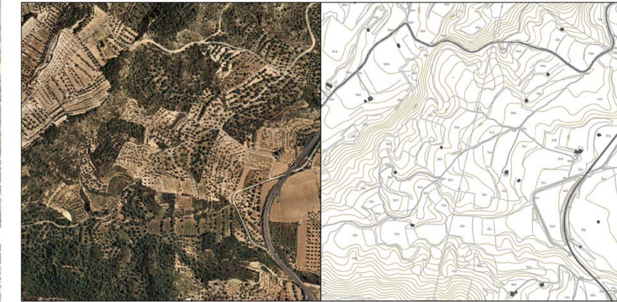
2 Camps agrícoles d'interior