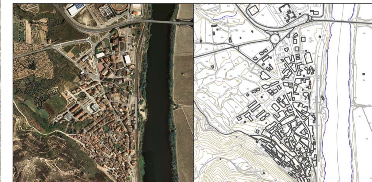
5 Nucli urbà