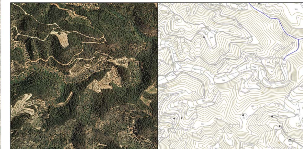
3 Serra de la Fatarella