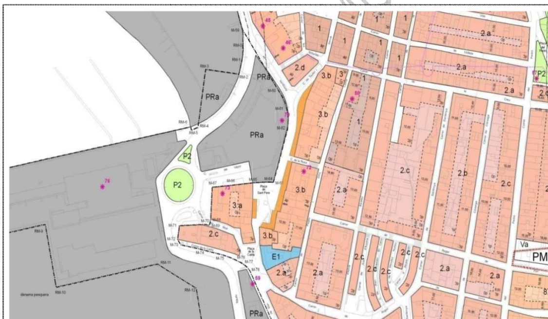
Plànol 1. Situació de les terrasses a l'àmbit 1 "La Planassa i la Plaça de la Catifa".

3. Legislació sectorial. Per a l'atorgament de les llicències caldrà tenir en compte les disposicions establertes a la Llei de costes i al Reglament que la desenvolupa, i les llicències s'atorgaran sense perjudici de l'autorització necessària de l'òrgan competent en la matèria.