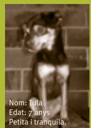
Nom: Tula Edat: 7 anys Petita i tranquil·la.