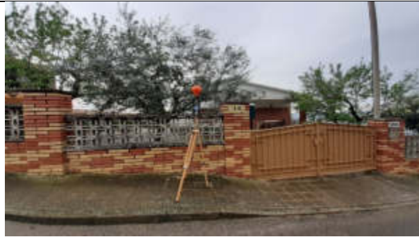
Punt de mesura 7: C. Noguera, casa 13 sota línia, cantonada C. Avet