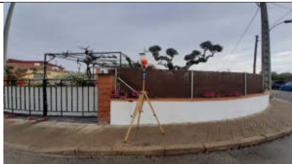
Punt de mesura 9: C. Desmai, davant casa 2, cant C. Noguera