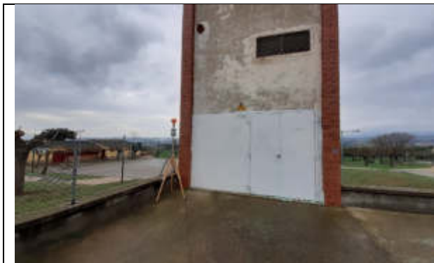
Punt de mesura 1: C. Cirerer, davant transformador VA07334, prop del local de l'AAVV