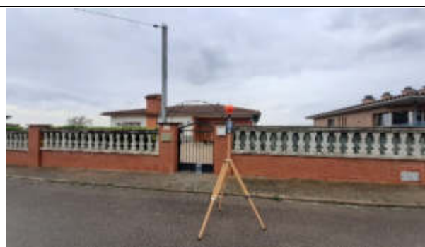
Punt de mesura 4: C. Cirerer, sota línia, davant casa 5