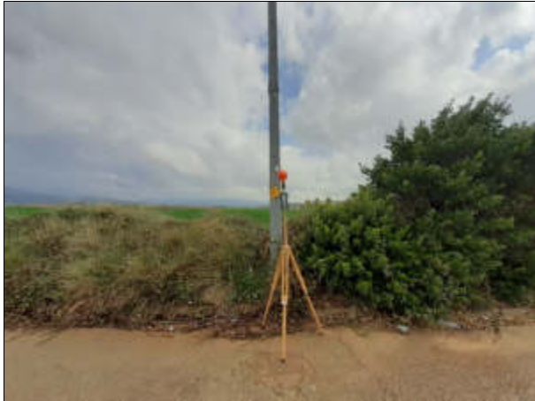
Punt de mesura 15: C. Illes, 11. Al costat de la línia