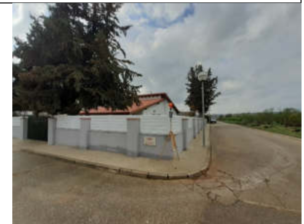
Punt de mesura 18 : C. Illes, 15. Al costat de la casa