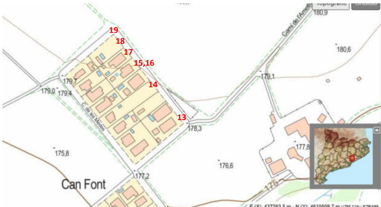
Localització dels punts de mesura a l'entorn de les línies d'alta tensió al sector Can Font