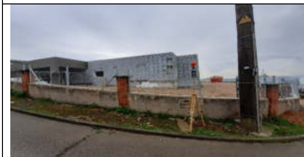
Punt de mesura 5: C. Cirerer, sota línia, cantonada C. Noguera