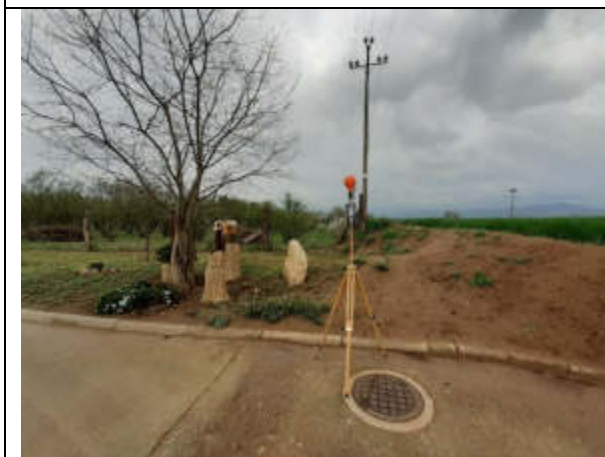
Punt de mesura 19: C. Illes, cantonada, al costat del talús