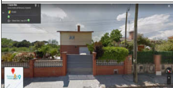
Punt de mesura 13: C. Illes, davant 1. Lluny de la línia