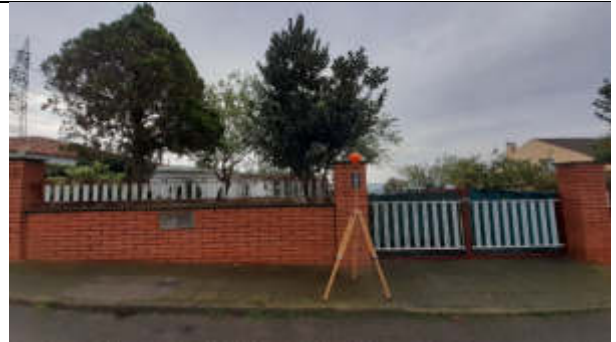
Punt de mesura 8: C. Noguera, sota línia, davant casa7, cant. C. Desmai