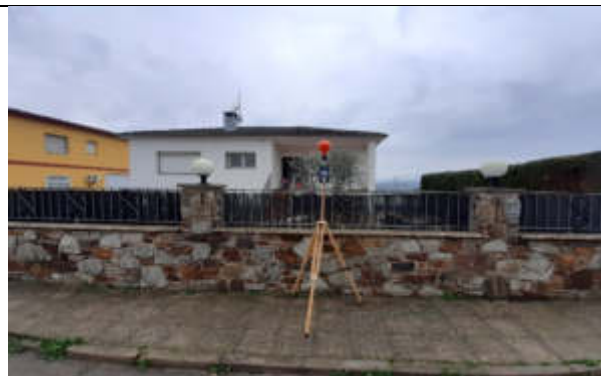
Punt de mesura 2: C. Cirerer, sota línia, davant casa 11