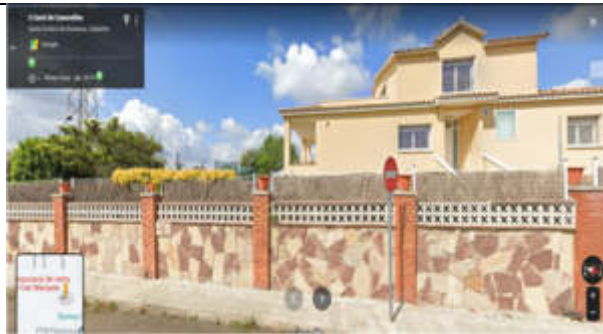
Punt de mesura 11: Camí de Canovelles, davant casa 3 prop del C. Noguera