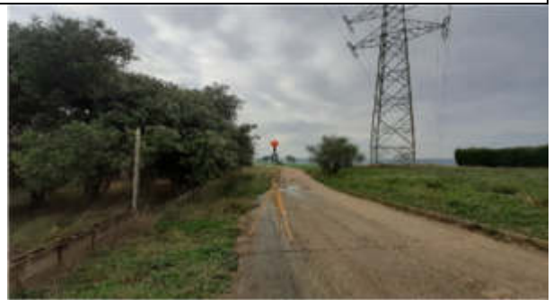
Punt de mesura 12: Camí de Canovelles a l'Ametlla, sota línia d'alta tensió