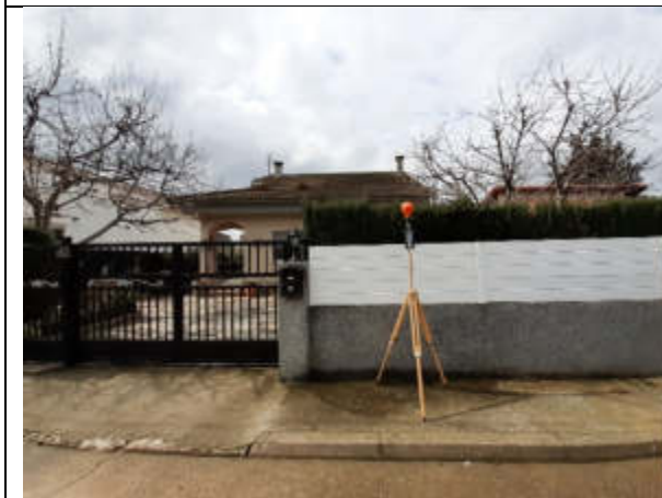
Punt de mesura 17: C. Illes, 13. Al costat de la casa