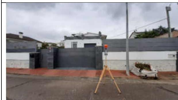
Punt de mesura 3: C. Cirerer, davant casa 10