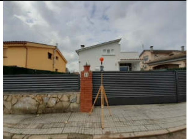
Punt de mesura 16: C. Illes, 11. Al costat de la casa