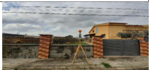
Punt de mesura 14 C. Illes, 9, vorera contrària a la línia