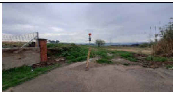
Punt de mesura 6: C. Cirerer, al final del carrer, a tocar del camp