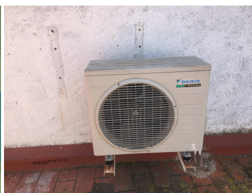
Figura 11. Split unitat exterior