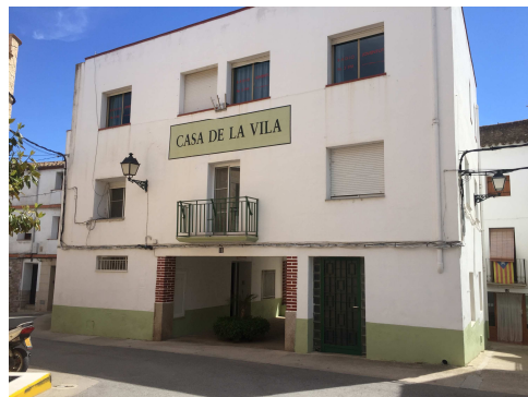
Figura 7. Façana exterior edifici

Mur monolític d'un full de gruix aproximat entre 40 i 60 cm de mamposteria (pedra), fàbrica de maó massís o combinació d'ambdues, arrebossat per l'exterior i enguixat per l'interior.