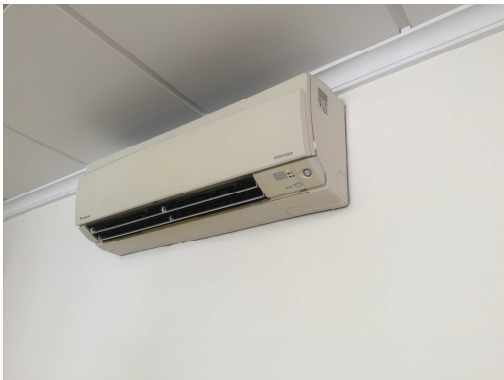
Figura 3. Reixes de ventilació i climatització

L'horari de funcionament de la calefacció és el mateix que l'horari d'obertura de l'edifici.