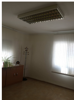
Figura 9. Sala