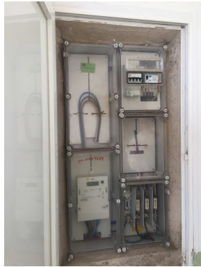
Figura 5. Comptador

La instal·lació disposa d'un comptador elèctric del tipus digital i el quadre general ubicat a l'entrada d'aquest, amb una bona sectorització, i un bon estat de conservació.