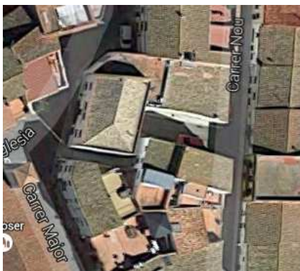
Figura 1. Plànol d'emplaçament