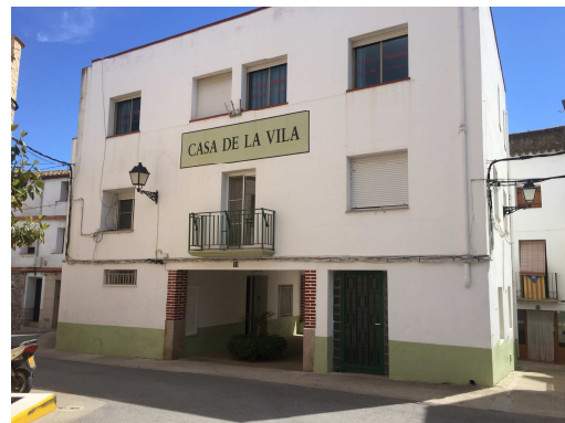
Figura 2. Façana principal de l'edifici

La Casa de la Vila és un edifici a tres vents i consta de planta baixa, i dos pisos, va ser construït l'any 1960. L'accés a l'edifici es troba a la plaça de l'església, 11 i la façana principal està orientada a l'oest.