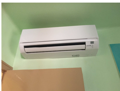
Figura 10. Split unitat interior