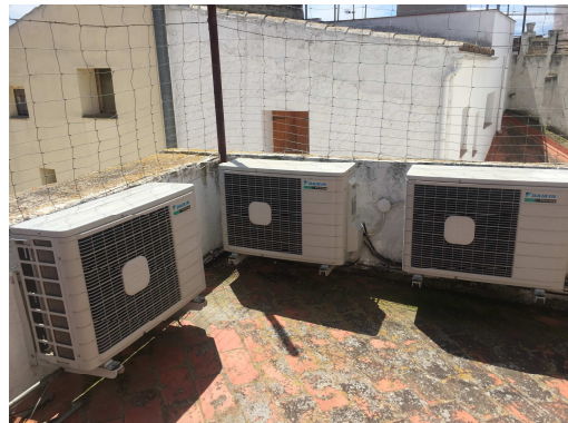
Figura 4. Termòstats de climatització