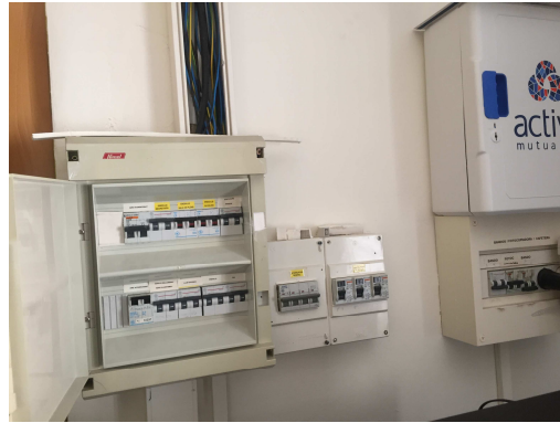
Figura 6. Quadre elèctric