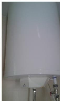
Figura 7. Termo elèctric

La producció d'aigua calenta sanitària als edificis es realitza mitjançant termos elèctrics, instal·lats als llocs de consum.