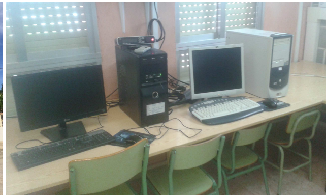
Figura 15. Interior escola