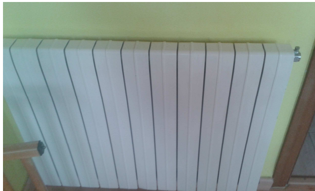
Figura 5. Unitat terminal