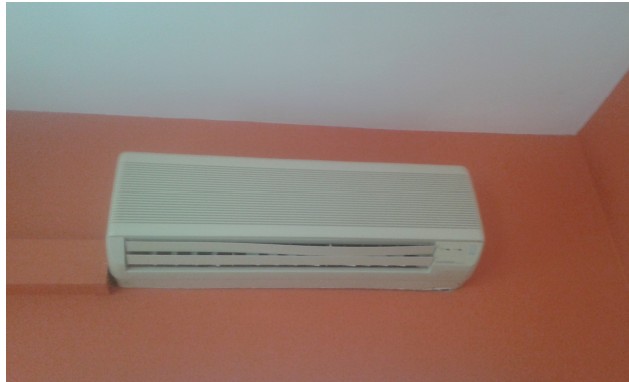
Figura 6. Unitats terminals tipus split