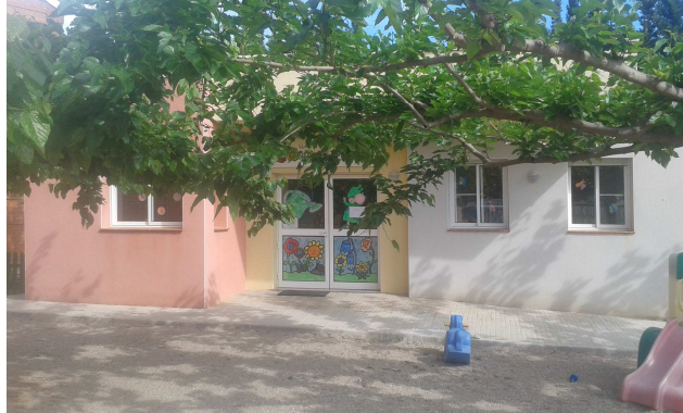
Figura 3. Façana principal de l'edifici Llar d'infants

La Llar d'infants és un edifici a quatre vents de planta baixa, construïda l'any 2002, es troba al costat de l'escola Rosa Gisbert, que és un edifici a quatre vents que disposa de planta baixa i primer pis construït aproximadament l'any 1987. L'accés als centres es troba al carrer La Galera, s/n i la façana principal està orientada al sud-oest.