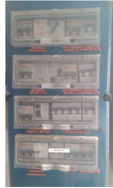
Figura 9. Quadre elèctric