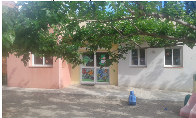
Figura 12. Façana exterior llar d'infants