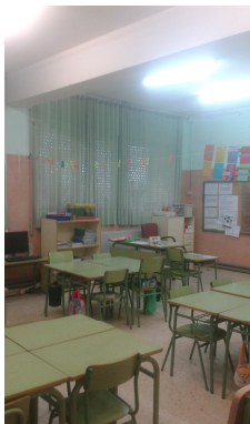
Figura 10. Enllumenat d'una aula

Principalment la il·luminació del centre es amb fluorescents amb balast electromagnètic, tot i que a mesura que es van foner es van canviant a fluorescents amb balast electrònic.