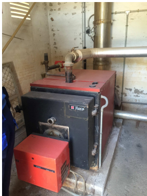
Figura 4. Generador de calor

La posada en marxa i apagada del sistema els duu a terme el responsable de la calefacció.