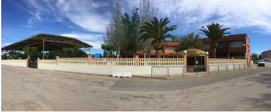
Figura 13. Exterior escola