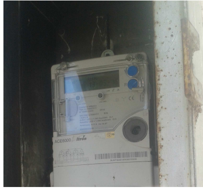
Figura 8. Comptador

La instal·lació disposa d'un comptador elèctric del tipus digital i el quadre elèctric ubicat a l'entrada d'aquest, amb una bona sectorització, la instal·lació elèctrica en general és acceptable, tot i que està previst dotar la instal·lació d'un nou comptador elèctric per independitzar-lo de la zona esportiva.