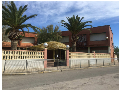
Figura 2. Façana principal de l'Escola