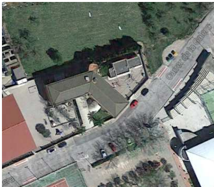
Figura 1. Plànol d'emplaçament