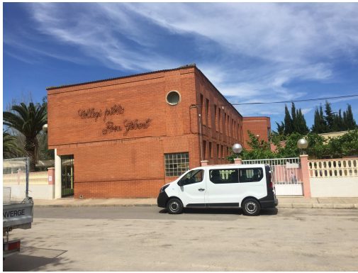
Figura 14. Exterior escola