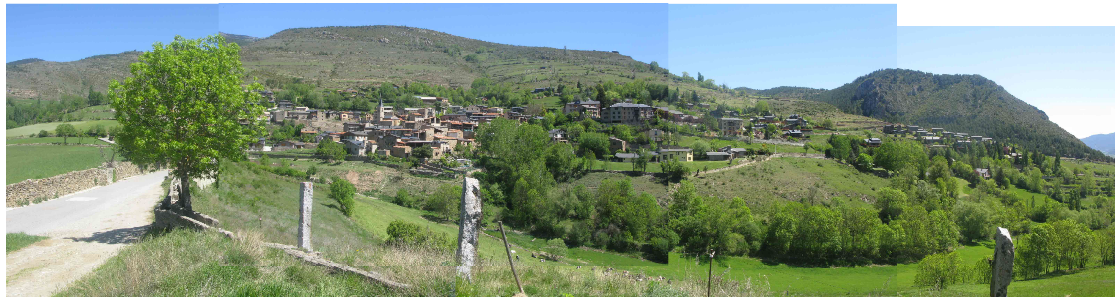
FOTO PANORÀMICA DE PRULLANS