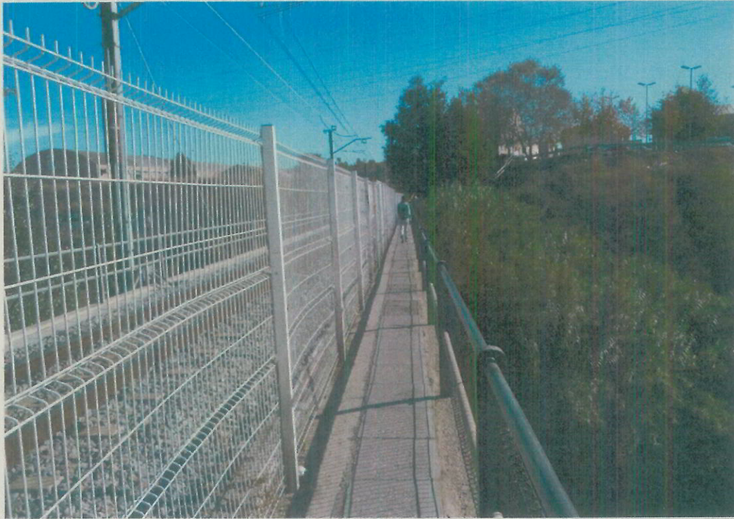
Vista de la passera en direcció Vilanova del Camí.