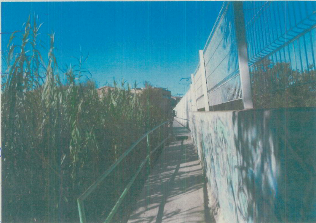
Vista de la passera en direcció Igualada.