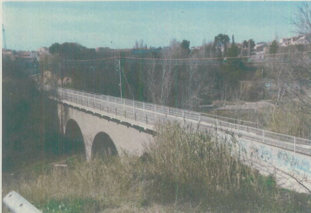
Vista general pont d'FGC sobre la riera d'Òdena.