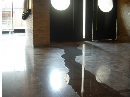
FOTO 2. Tolls en l'accés al