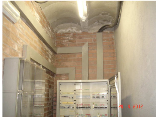
FOTO 4. Filtracions en la zona on es situen els quadres elèctrics.

En una inspecció a la coberta és veu que es tracta d'una coberta invertida amb acabat de palet de riera.