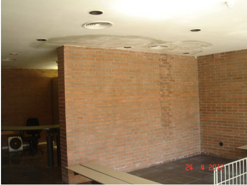
FOTO 1. Vista del fals sostre vestíbul després de pluges.