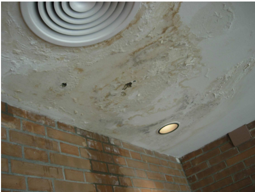
FOTO 3. Vista d'una de les nombroses filtracions en el vestíbul