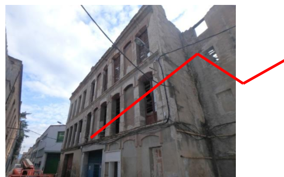
FOTO 2. VISTA DES DE SANT ANTONI DE BAIX