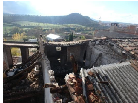
FOTO 4. VISTA DE PLAQUES DE FIBROCIMENT A PLANTA

A la coberta es van detectar aproximadament 20,00 m 2 de plaques de fibrociment que s'han de retirar segons el decret 396/2006.