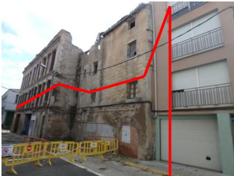
FOTO 3. VISTA DES DE SANT ANTONI DE BAIX COBERTA