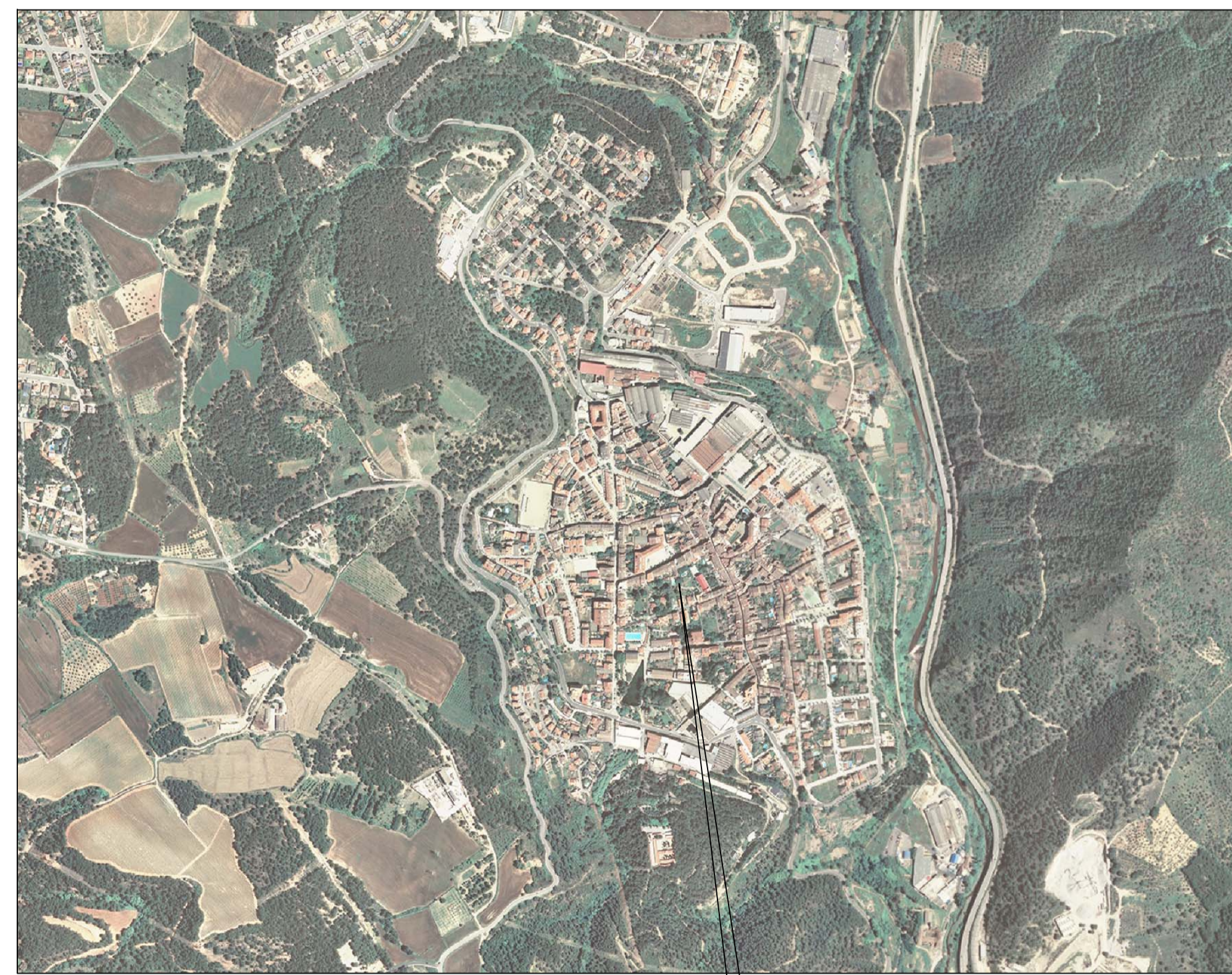
SITUACIÓ AMB ORTOFOTOMAPA S/E