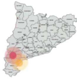
Mapa territorial d'aplicació del Fons de Transició Nuclear

La distribució dels imports serà del 50 % per a cada zona de planificació.