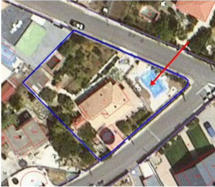
Detall ortofotomapa 2022

CINQUÈ. Que revisat l'arxiu municipal i el gestor d'expedients de l'Ajuntament, es comprova que consten els següents expedients d'obres: