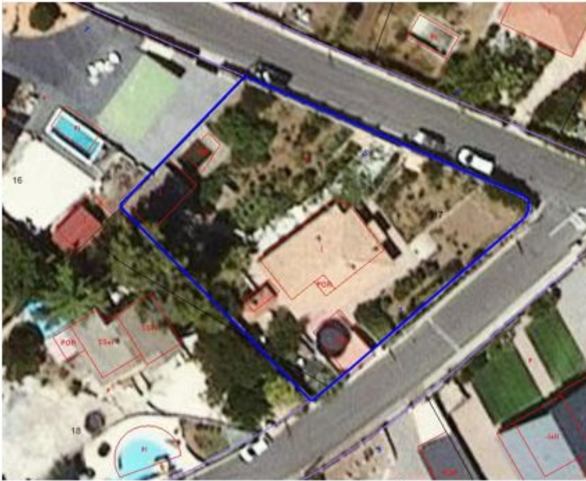
Detall ortofotomapa 2021, amb la delimitació de la parcel·la