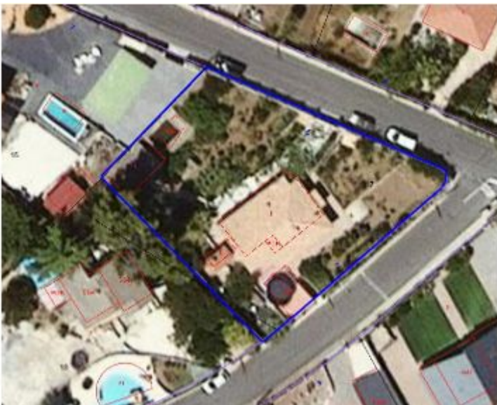
Detall ortofotomapa 2021, amb la delimitació de la parcel·la