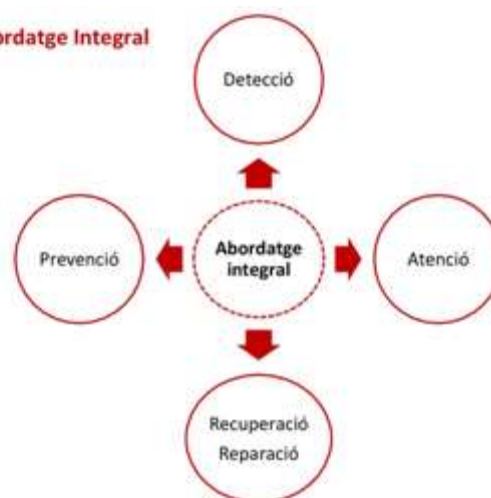
Gràfic 2. Abordatge Integral

Prevenció: el conjunt d'accions encaminades a evitar o reduir la incidència de la problemàtica de les violències masclistes, per mitjà de la reducció dels factors de risc, impedit-ne així la normalització, i les encaminades a sensibilitzar la ciutadania en el sentit que cap forma de violència no és justificable ni tolerable. Aquestes actuacions tenen com a objectiu modificar els mites, els models, els prejudicis i les conductes en relació amb les dones, així com també els rols i estereotips de gènere, i han de recollir els elements següents: (a) presentar el fenomen com a multidimensional; (b) emmarcar el problema en la distribució desigual de poder entre dones i homes; (c) Visibilitzar els models agressius vinculats a la masculinitat tradicional i les conductes passives o subordinades tradicionalment vinculades a la feminitat; (d) diferenciar l'origen i les causes de la violència masclista dels problemes afegits que puguin afectar els agressors (toxicomanies, alteracions mentals...) i de determinats nivells culturals, estatus socioeconòmic i procedència cultural i; (e) presentar les dones que han patit violència com a persones que poden activar els recursos propis i superar aquestes situacions.