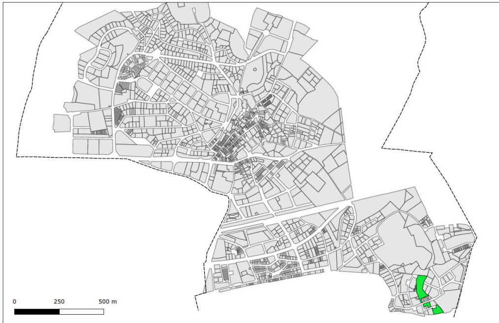
ANNEX. Àmbits afectats per la suspensió de tramitacions i llicències

Altafulla, a la data de la signatura electrònica