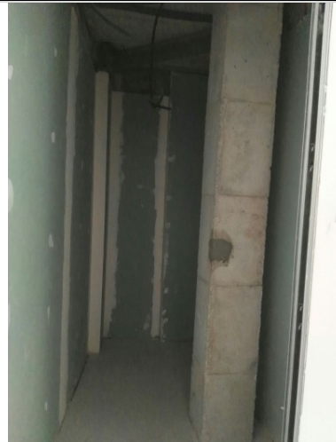
Bany sense executar als trasters