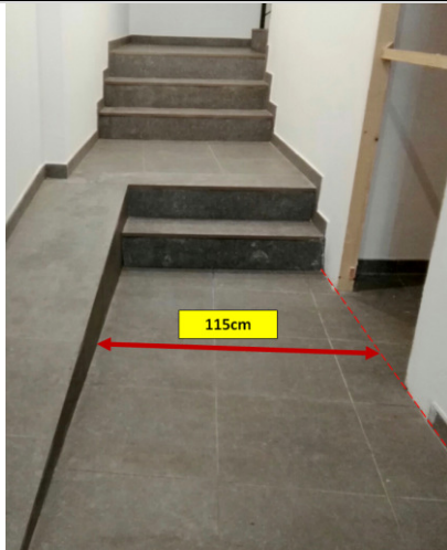
Mida davant previsió ascensor