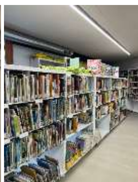
Espai col·lecció local