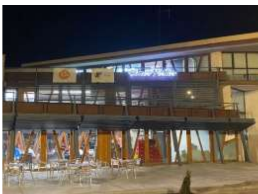
Il·luminació nadalenca exterior (desembre)