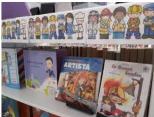
Racó d'oficis (març)