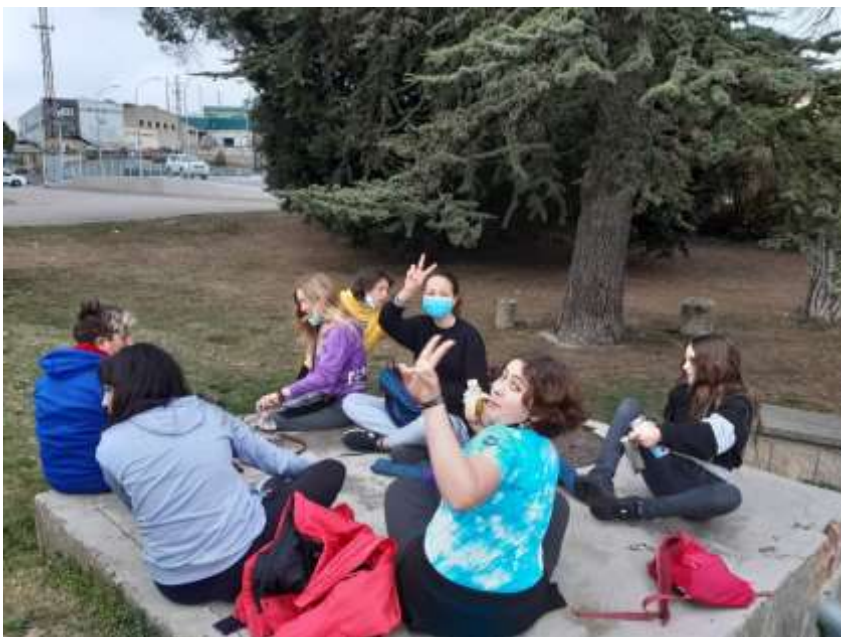
Anem d'excursió, esmorzant