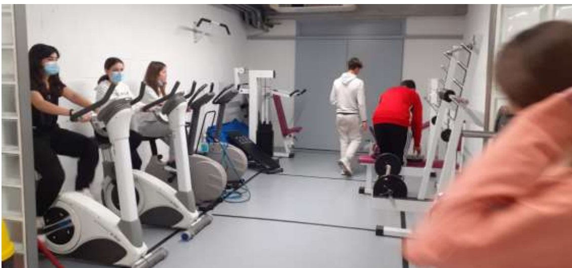
Anem al gimnàs