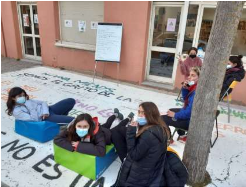
Assemblea tarda jove