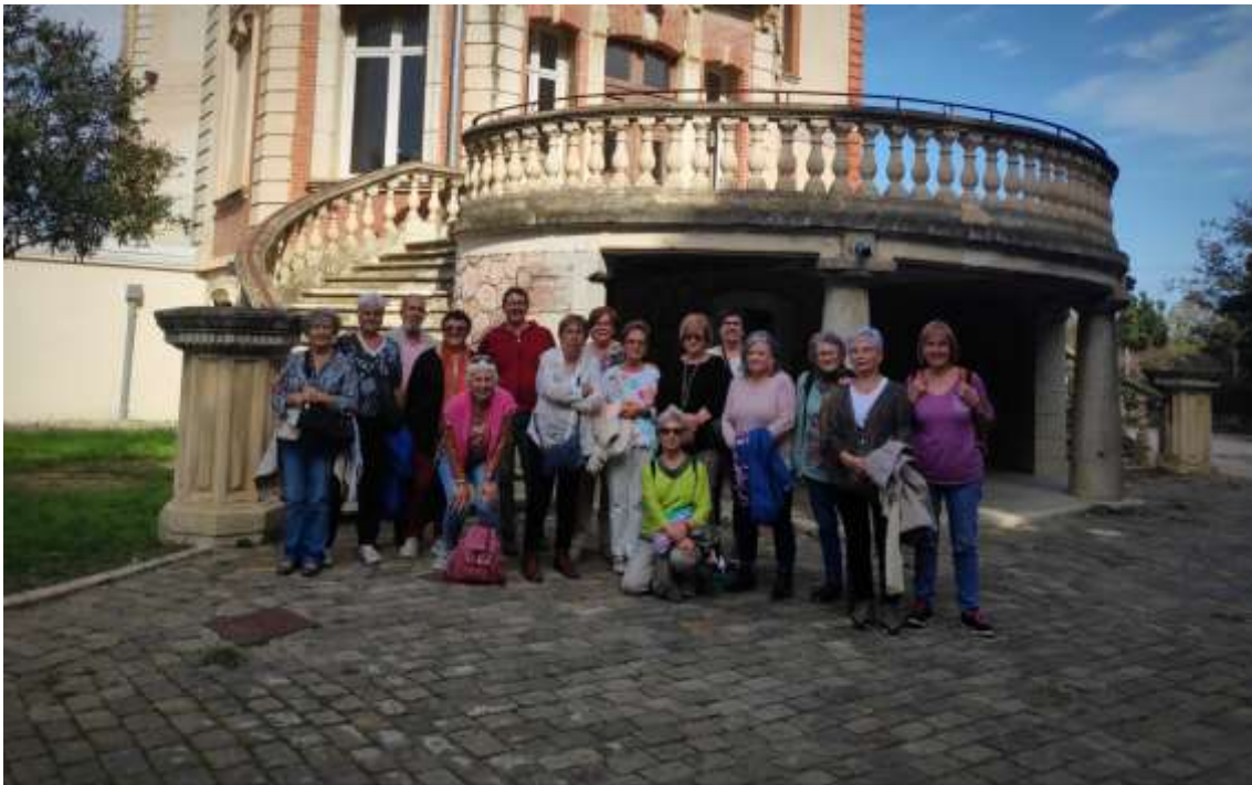
El grup de Tertúlia a La Maternitat d'Elna