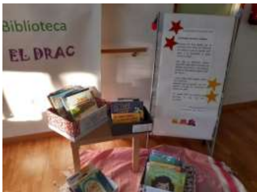
Han passat els Reis! (gener)