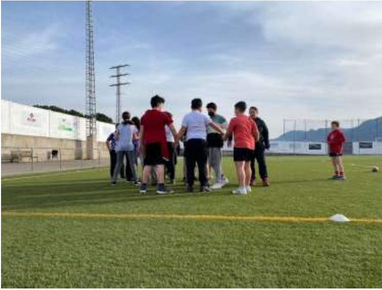
Tastets de rugby