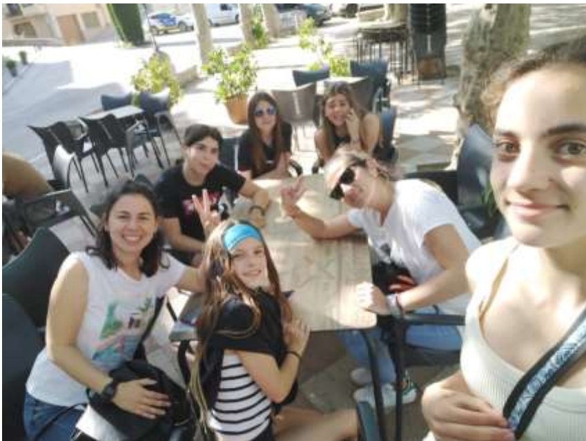
Anem de "tapeo"