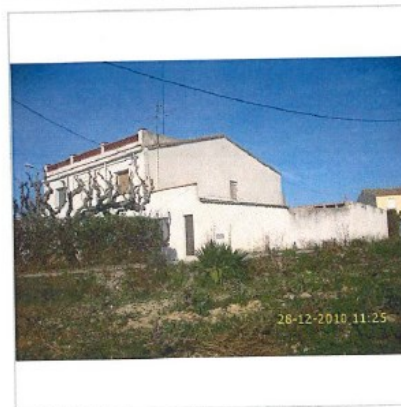
Fotografia de context