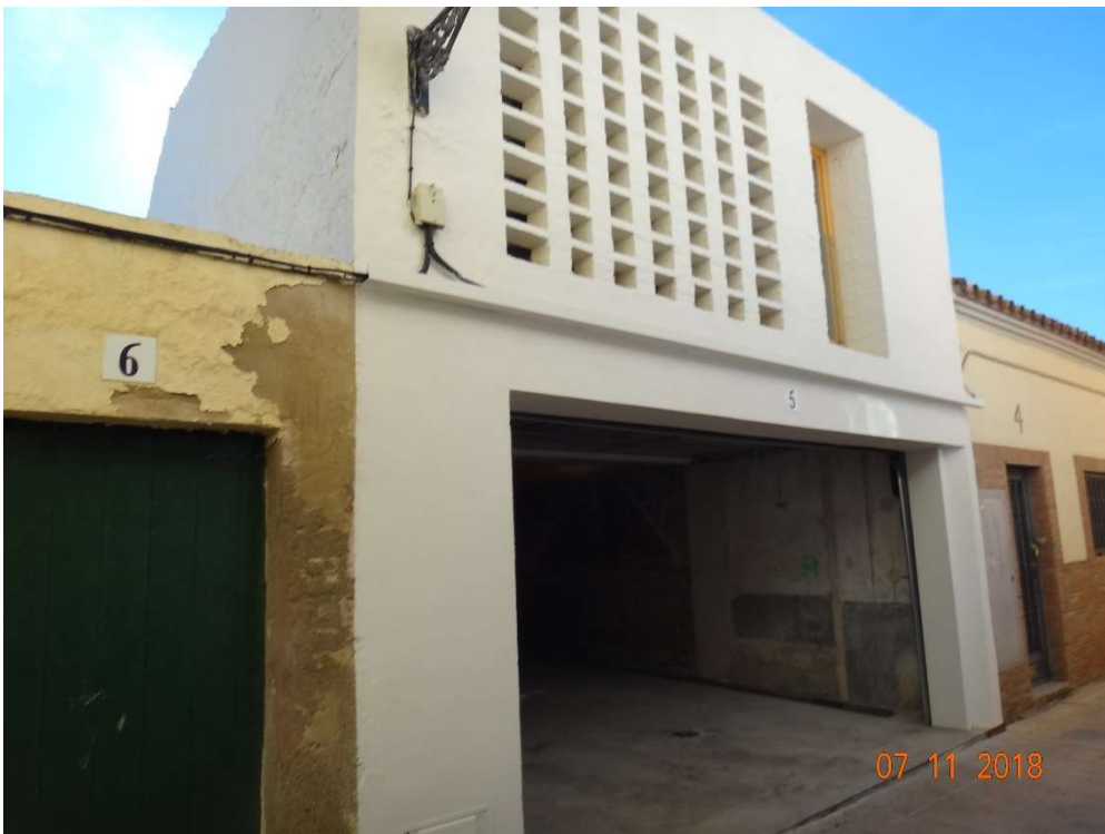
Fotografia de la façana executada amb front al passatge de Sant Josep.