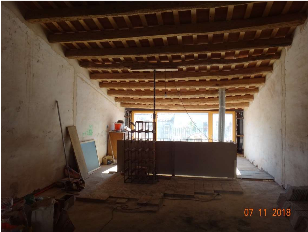
Fotografia de l'estat de l'edificació amb front al passatge de Sant Josep.