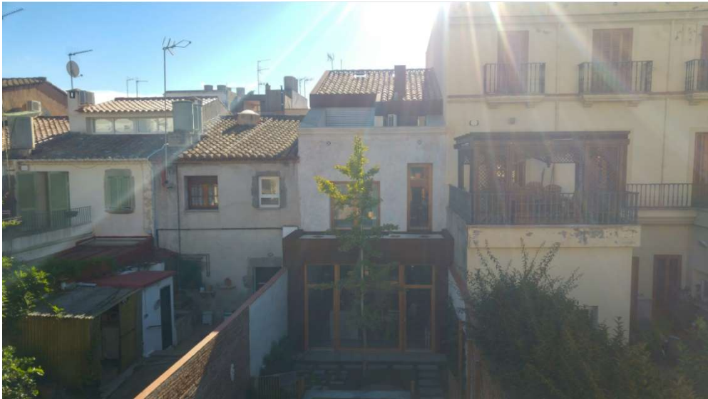
Façana posterior de l'edificació amb front al carrer Sant Josep.