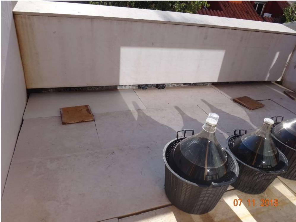
Fotografia del solàrium amb front al carrer Sant Josep.