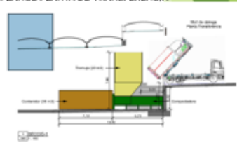
PLÀNOL PLANTA DE TRANSFERÈNCIA