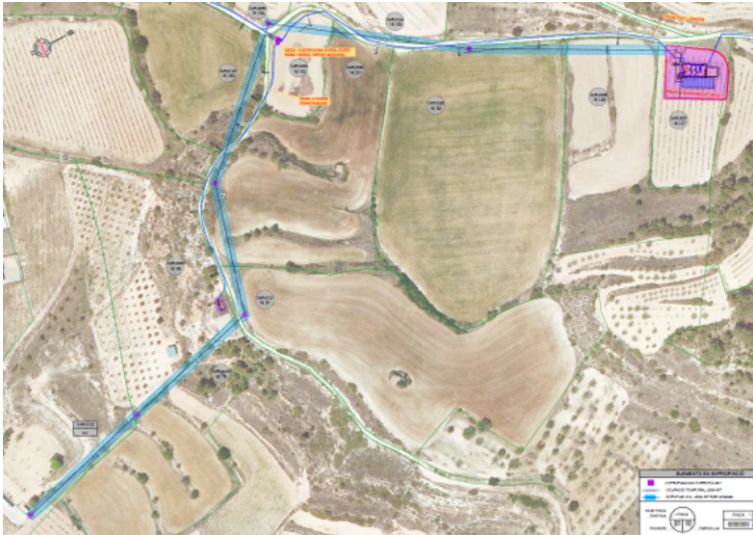
Traçat aeri projecte