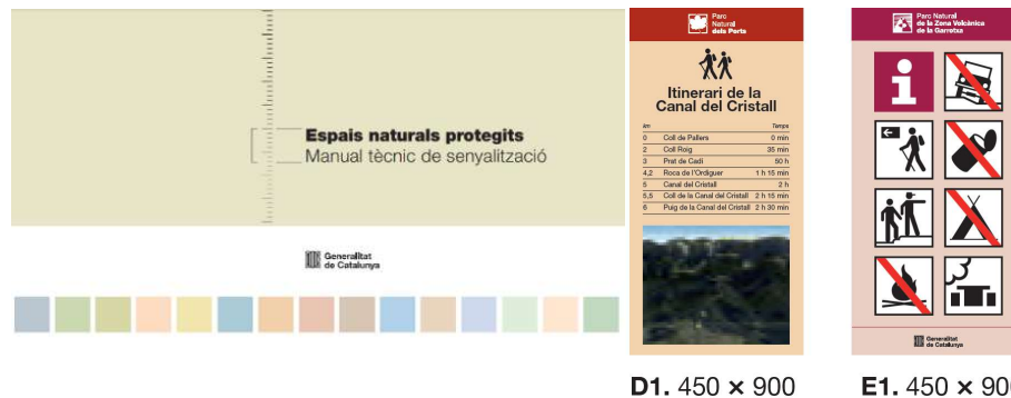
D1. 450 x 900

La resta de senyalització genèrica (fora de l'estrictament de trànsit) serà la determinada pel manual tècnic de senyalització d'espais naturals protegits, aplicant els models de cada espai protegit que sigui més adient, i a la resta del territori (fora ENP) aplicant el color magenta i posant l'escut del municipi. S'implementaran 2 cartells informatius de regulació segons model proposat, indicant que al municipi s'ha realitzat una regulació de l'accés motoritzat al medi natural d'acord amb la normativa que determina el decret 166/1998, amb l'objectiu de preservar els espais naturals, no produir afectacions negatives irreversibles en els ecosistemes en els llocs estratègics determinats i donar seguretat jurídica als usuaris.