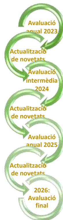
Figura 2. Moments d'avaluació del PLIAR

Cada any, a més, aprofitant les visites que es fan a l'octubre als centres educatius per a la presentació del Consell d'Infants i l'elecció de consellers i conselleres, es passarà un petit qüestionari a l'alumnat per conèixer i recollir les seues opinions respecte a la implementació del Pla i les propostes que puguin fer. La informació es traslladarà a la resta d'espais de treball per a la seua consideració.