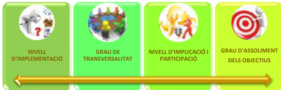
Figura 3. Aspectes a avaluar del Pla

Donat que el Pla està estructurat al voltant d'uns eixos estratègics i que en cada un dels eixos es plantegen uns objectius transversals i unes accions per a assolir-los que requereixen la implicació i participació de múltiples agents, cal avaluar els següents aspectes.