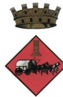
AJUNTAMENT DE LA GALERA