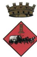
AJUNTAMENT DE LA GALERA