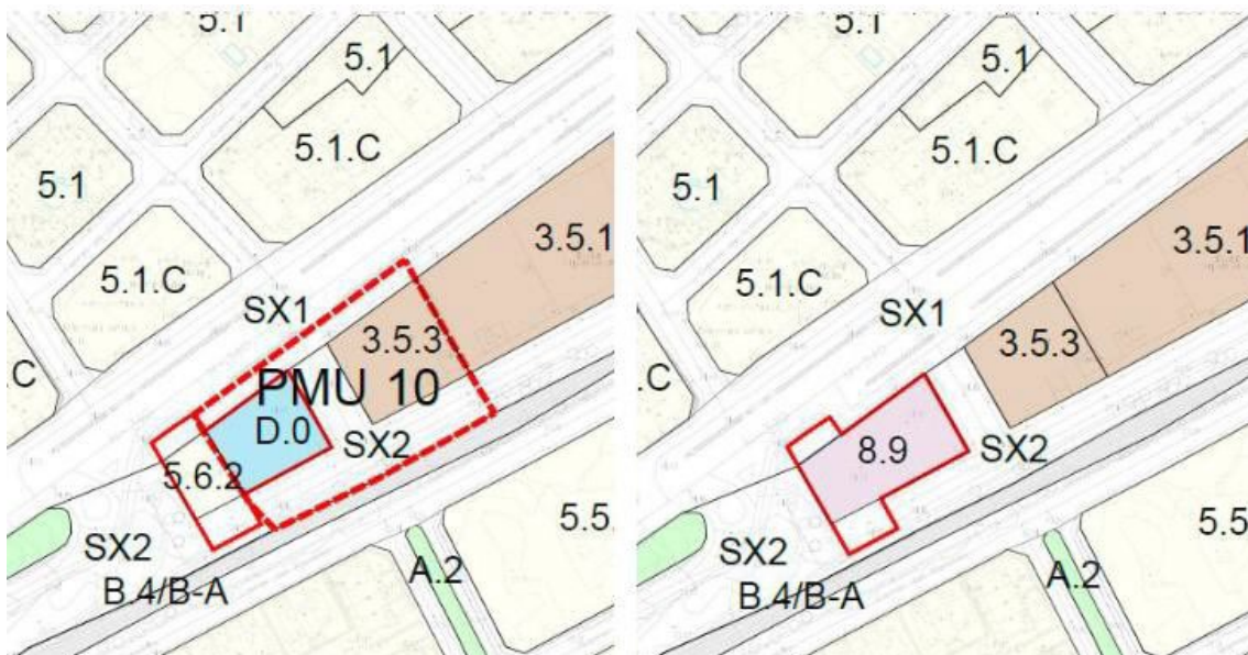
Plano Subàmbit 1: proposta de modificació

- Modificar l'article 149 i concordants de les Normes del POUM. En aquest article s'estableix la prohibició genèrica d'implantar noves estacions de servei en sòl urbà consolidat. Caldrà regular les condicions per la implantació d'estacions de servei en sòl urbà vinculada a l'activitat comercial mitjançant la creació de una nova subclau.