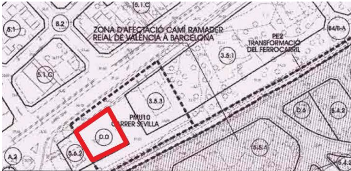
Subàmbit 1- Plànol d'ordenació. Qualificació (Planejament vigent)

II.- L'entitat mercantil GESDIP, SAU, es propietària de la finca situat al carrer de Montblanc, 16, de Mont-roig del Camp, que respon a la següent descripció registral: