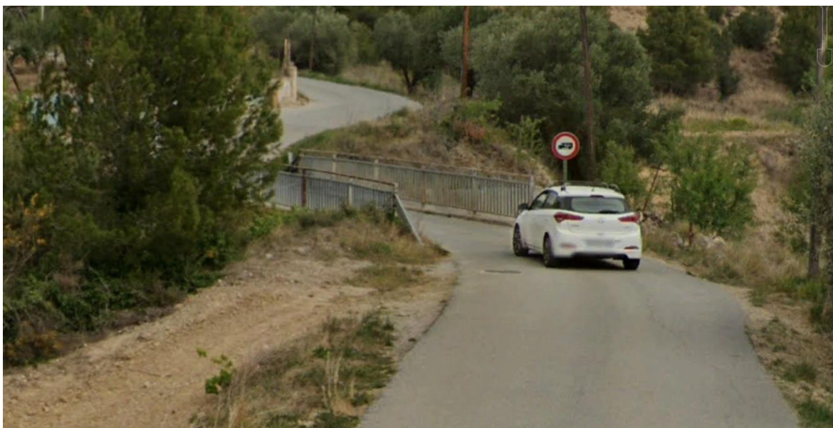
Vista general del pont. Cal destacar l'emplaçament de l'estructura del pas superior, en esbiaix respecte el traçat del camí. El projecte constructiu preveurà el perllongament de les barreres de contenció de vehicles a ambdós costats del pont, per reforçar la seguretat vial.

ANNEX 2. Plànol de l'Alternativa I del "Estudi d'alternatives d'adequació segons la OC 25/2014 dels sistemes de contenció del pas superior del Camí de la Beguda (clau: LA_SE-BE_INF_EA_23_213)"