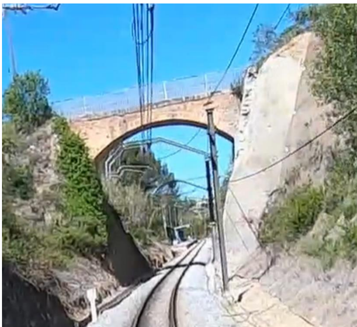
Vista de pas superior des de la plataforma ferroviària.